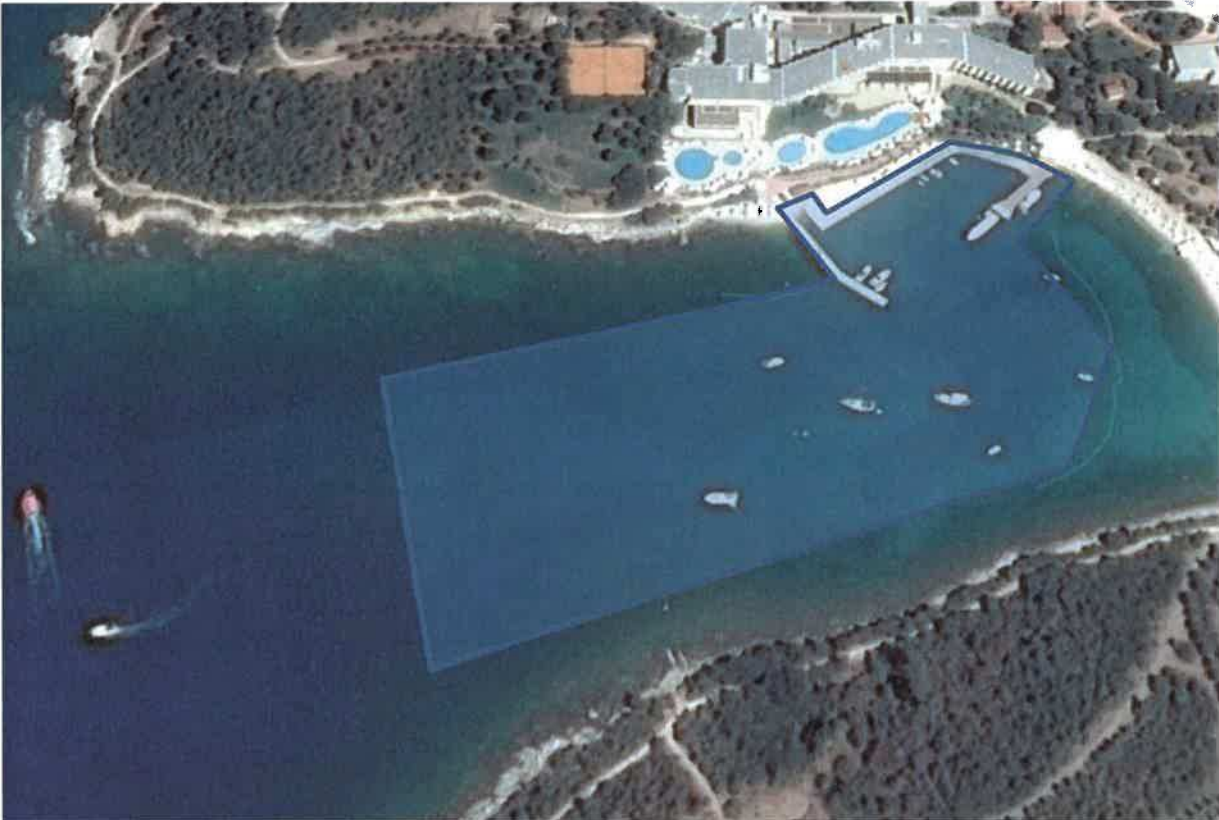
Nautički vezovi i sidrište