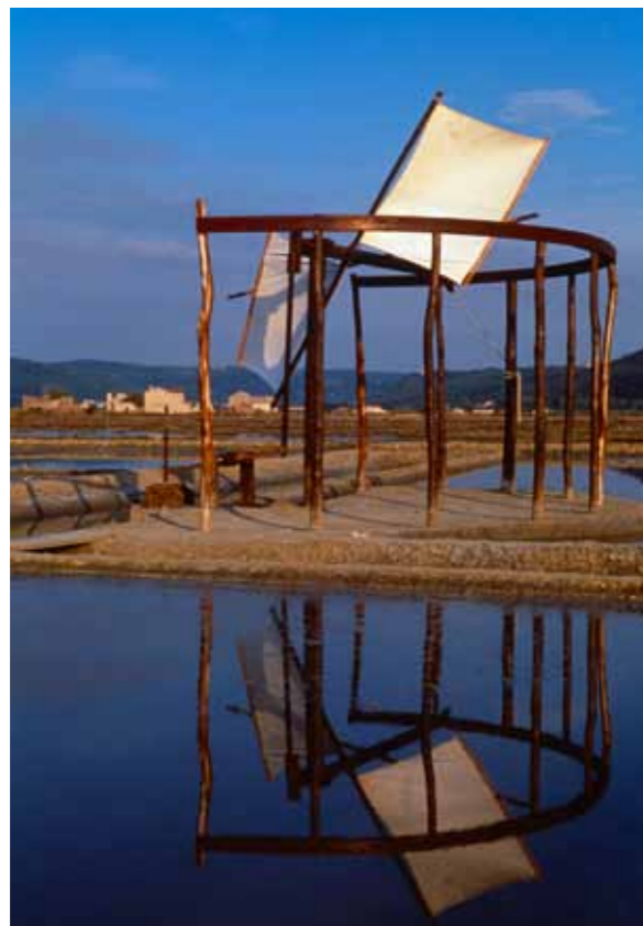
Sečovlje-Fontanigge, mulliri me pompe uji

nje karakteristik pejsazhit dhe karakteristikat te njohjes . Muzeumi i krypores e ka ruajtur dhe perseritur prodhimin e paster teknologjik te krypes sipas tradites Venedikase nga siperfaqet burimore te fushat e gjelpta, menyren burimore te prodhimit , si dhe magazinimin ne shtepit e renovuara te kryptarve. Ne pjesen e kryporeve te seqovljes te quajtura Lera dhe ne Strunjan fillimi i shekullit 20 ka ndikuar ne modernizimin e prodhimit me redistribucionin e bazenave me pompa motorike dhe transportin sikur se behet ne teknologjine e xehtarise edhe pse prodhimi i krypes edhe metutje bazohet ne materijalet tradicionale , prej cavedinave te perpunuara nga balta e krypes deri te korja siperfaqesore petole. Krypa prodhohet ekskluzivisht me ndihmen e djellit, frymes dhe ujit te detit. Shume prodhime sikur se lulja e krypes dhe aqua madre ( qelizat e koncentruara shume lart) jane prodhimet me te mira ne industrine e krypes.