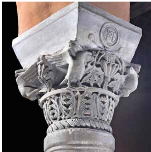
Poreč, Bazilika e Eufrazijanit, kryeqyteti i Bizantit

monizuar me planin grafik te bazilikes se tashme perveq ne pjesen lindore ku mbaron me nje murre te rafsh. Mozaiket e dyshemes Paraeufrazijane jane ruajtur perfundi dyshemes te kishes se sotme ( bazilika Eufrazijanit) ne kete shenjtoe ka qene sinthronos-nje bank gjysemharkore per priflerinjet dhe ipeshkvit. Qilimat e mozaqeve Paraeufrazijane mund te shifen pjeserisht permes gavrave te cilat egzistojne ne dyshemen perdhese te kishes se sotme. Bazilika me e vogel Paraeufrazijane eshte ruajtur ne pjeset arkeologjike te vjetra te harkut triumfal dhe fillimin dhe fillimin e deres afer saj. Ne periudhen e hershme te shekullit te mesem kjo kishë ka qene e reduktuar ne nje sipërfaqe te nje vaporit te mesem kurse ne apside eshte vendosur nje sarkofag i madh prej gurrit perfundi shkëmbinjeve te granitit dhe literi i murrit afer ti. Ne fazen e dyt te adaptimit ne shekullin e hershem te mesem apside eshte kufizuar me venjen e tri apsidave te vogla. Gjat shekullit 14dhjet kjo sipërfaqe ka qene e reguluar per sakristi. Ne murre shifen te mbeturat e pikturave te stilit