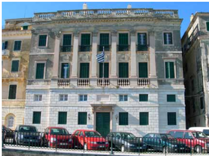
Corfu, Pallati I Koprit