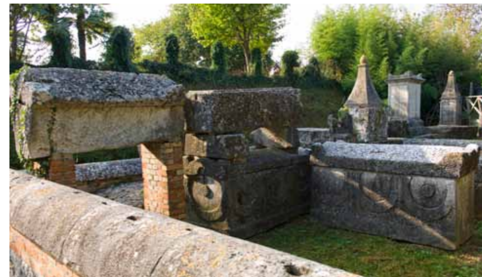
Aquileia, nekropola Romake

edhe sot. Egzemplaret jane renditur ne tri etazhe ( kate) ne dymbdhjet dhoma dhe vazhdojne ne galerine lapidariumit( 1898). Nje depo gjithashtu eshte hapur per publikun me disa egzemplar te ri te ekspozuara siq eshte aje ne Via Annia ( rruga kryesore e cila shkone nga Veneta) e hapur ne v. 2011. Mbrendesija e Muzeumit eshte rregulluar teresisht ne v. 1955 kurse zonat e ekspozuara pa nderprer ne kontinuitet modernizohen dhe renovohen per te mundesuar menyren e vjeter te hulumtimeve te vjetersirave ( antikviteteve).