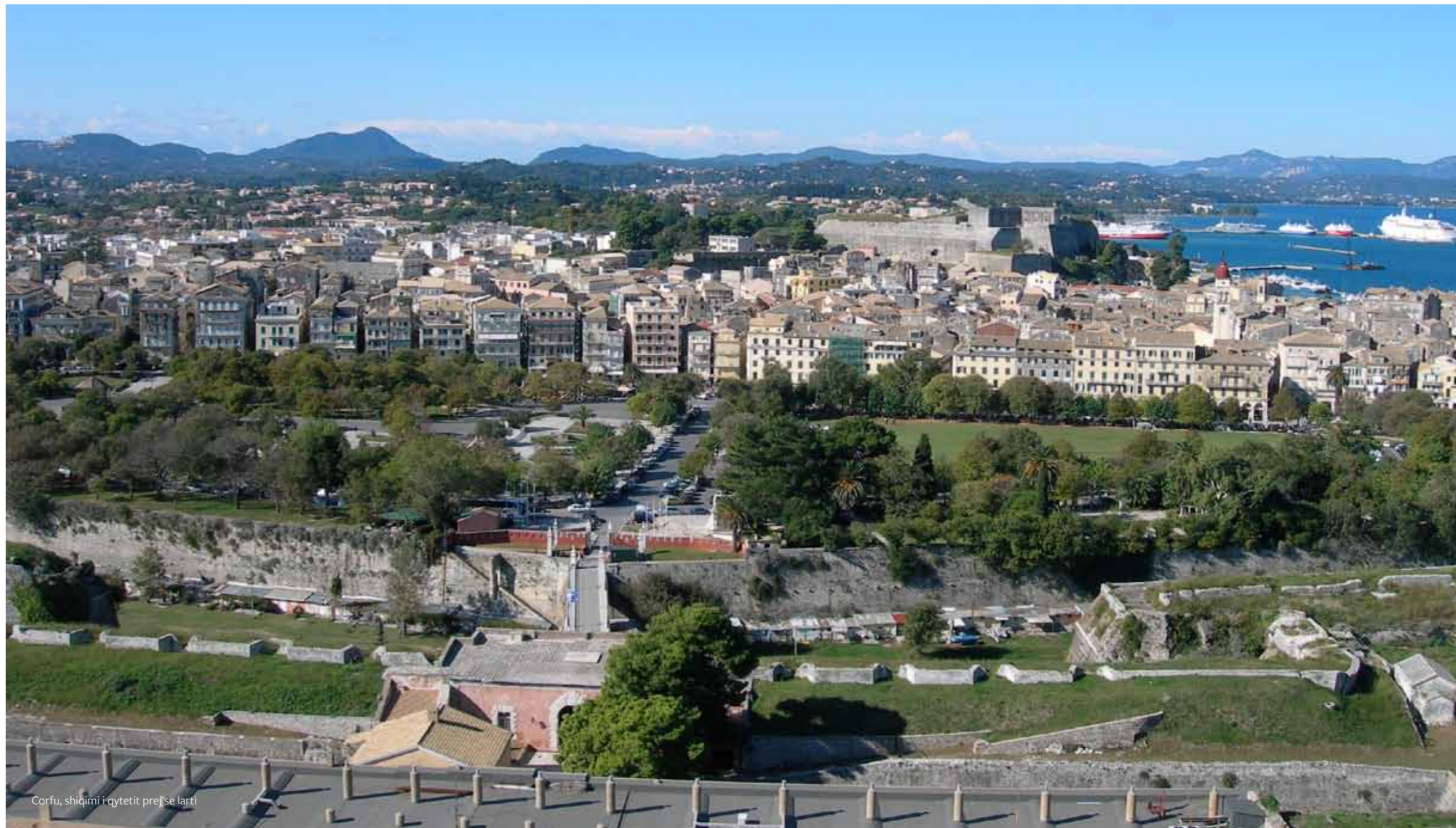
Corfu, shikimi i qytetit prejse larti

Qyteti vjetër Kerf në ujdhesën Korfuz në pjesën perëndimore të bregdetit të Shqipërisë dhe Greqisë ndodhet në një pozite strategjike në hyrje të detit Adriatik. Renjet e këtij qytetit datojnë prej shekullit 8, para Krishtit tri fortifikata të qytetit të cilat i kanë projektuar inxhinjeret e njohur të Venedikut katër shekuj I kanë ruajtur interesat tregëtare të Republikës së Venedikut kundrejt imperatorisë Osmane. Fortifikatat gjat tërësimit janë renovuar dhe pjesërisht rindërtuar, dhe në kohën më të re nën udhëheqjen Britanike në shekullin 19. Kryesisht fondi neoklasik banesor në Qytetin e vjetër i takon pjesërisht periudhës Venedikase, kurse një pjesë është ndërtuar më vonë, e posaqmë në shekullin 19dhjet. Tërësija urbane dhe e limanit të Korfuzit si një lima mesdhetar është shumë lart e vlerësuar përshkak të tërësive dhe autenticitetit. Tri