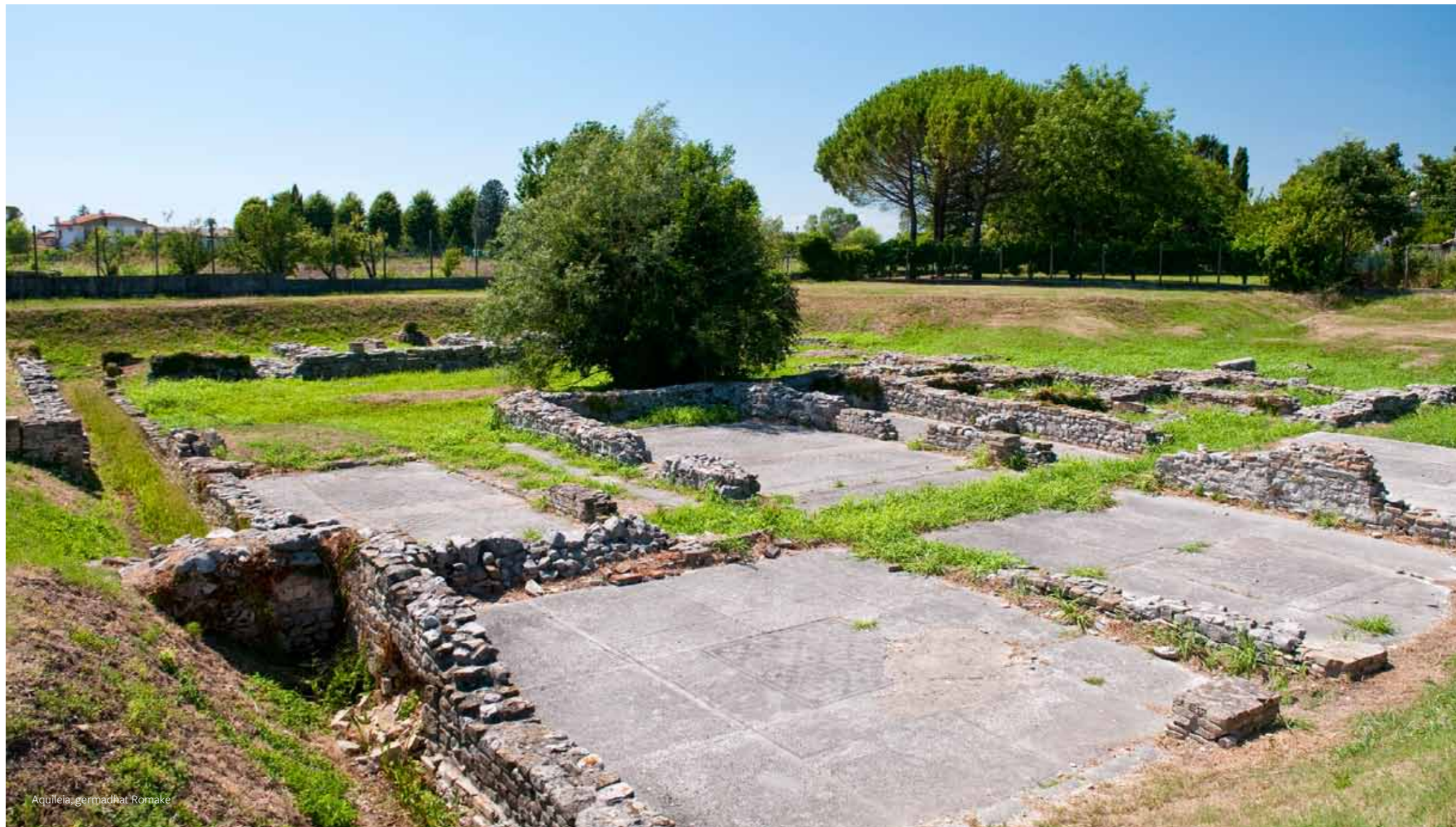
Aquileia, gerdhat Romake

Fondacioni Akvileja ( Fondazione Aquileia , www.fondazioneaquileia.it ) bashkarisht ne pranveren e vitit 2008 e ka themeluar ministrija per trashëgimin kulturore dhe veprimtari