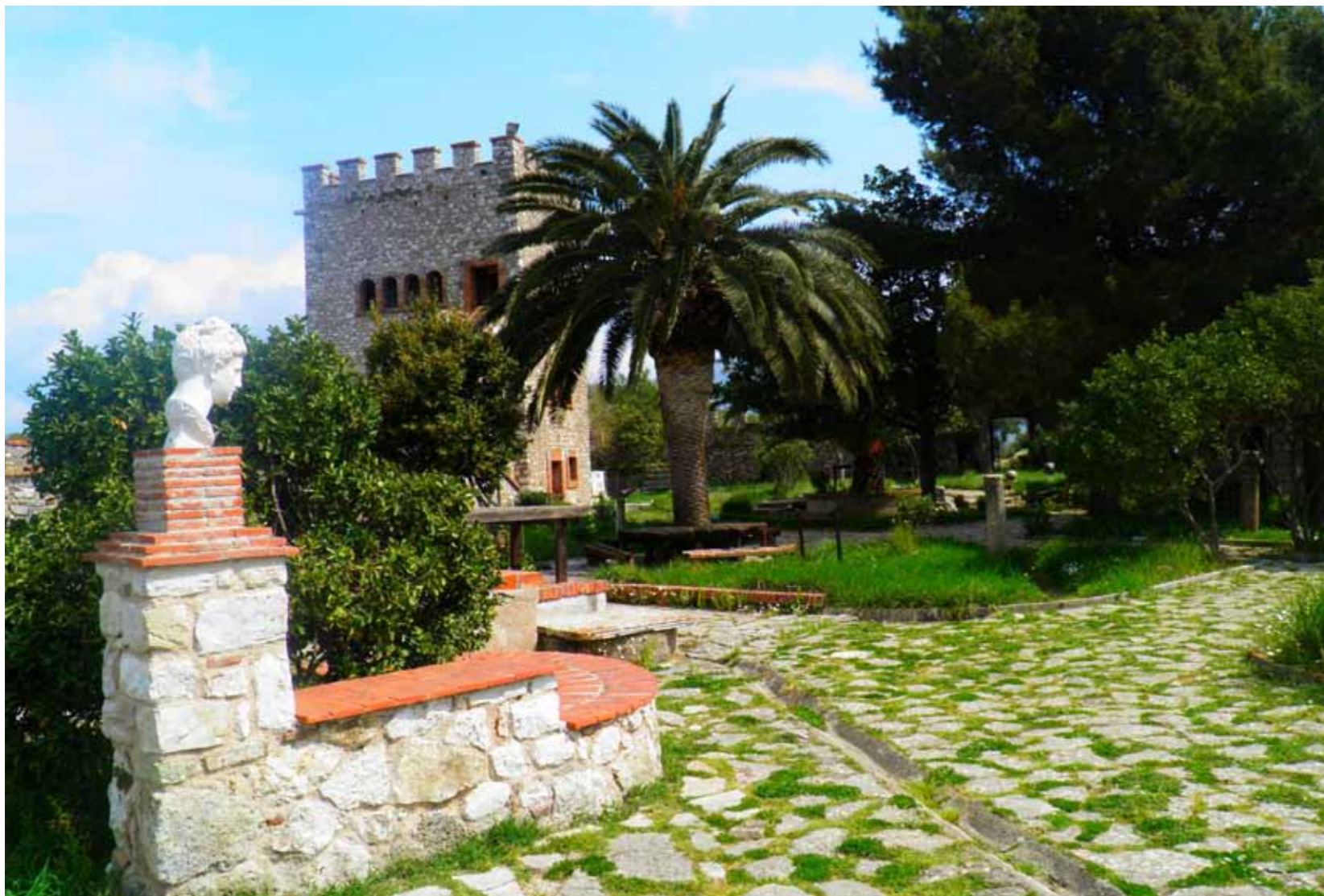
Butrint, keshtjella e Venedikut