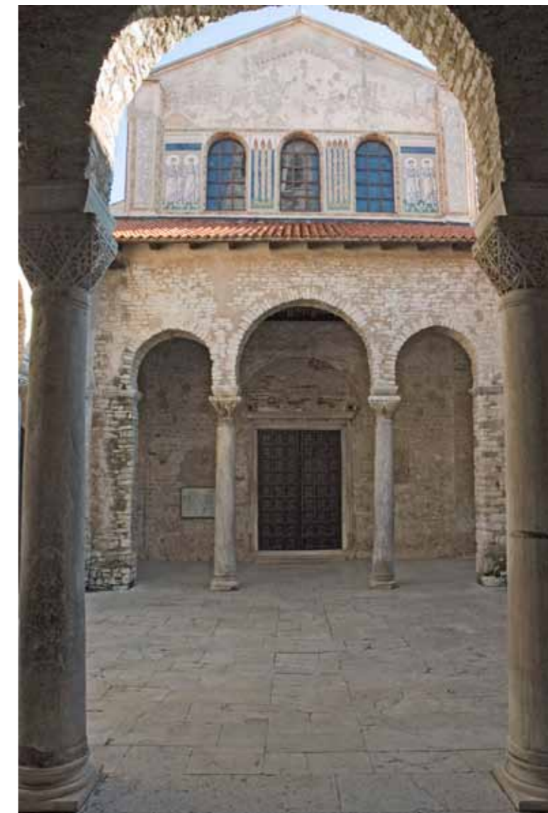
Poreč, Bazilika e Eufrazijanit, Atriumi dhe pjesa e perparme e kishës

Në mes të shekullit V kisha e parë është renovuar në mënyrë radikale dhe e zmadhuar. Këtë fazë të ndërlidhjes së Katedrales e quajmë paraeufrazijane. Është përbërë nga dy bazilika paralele trevaporshë, bashkarisht të ndara në lokalitetet të vogla dhe me cisternë. Para pjesës së jashtme të dy bazilikave është shtrirë një narteks i gjat me dyshemenë e mozaikëve (motivi ashtit të peshkut). Bazilika e madhe (e jugut) është e har-