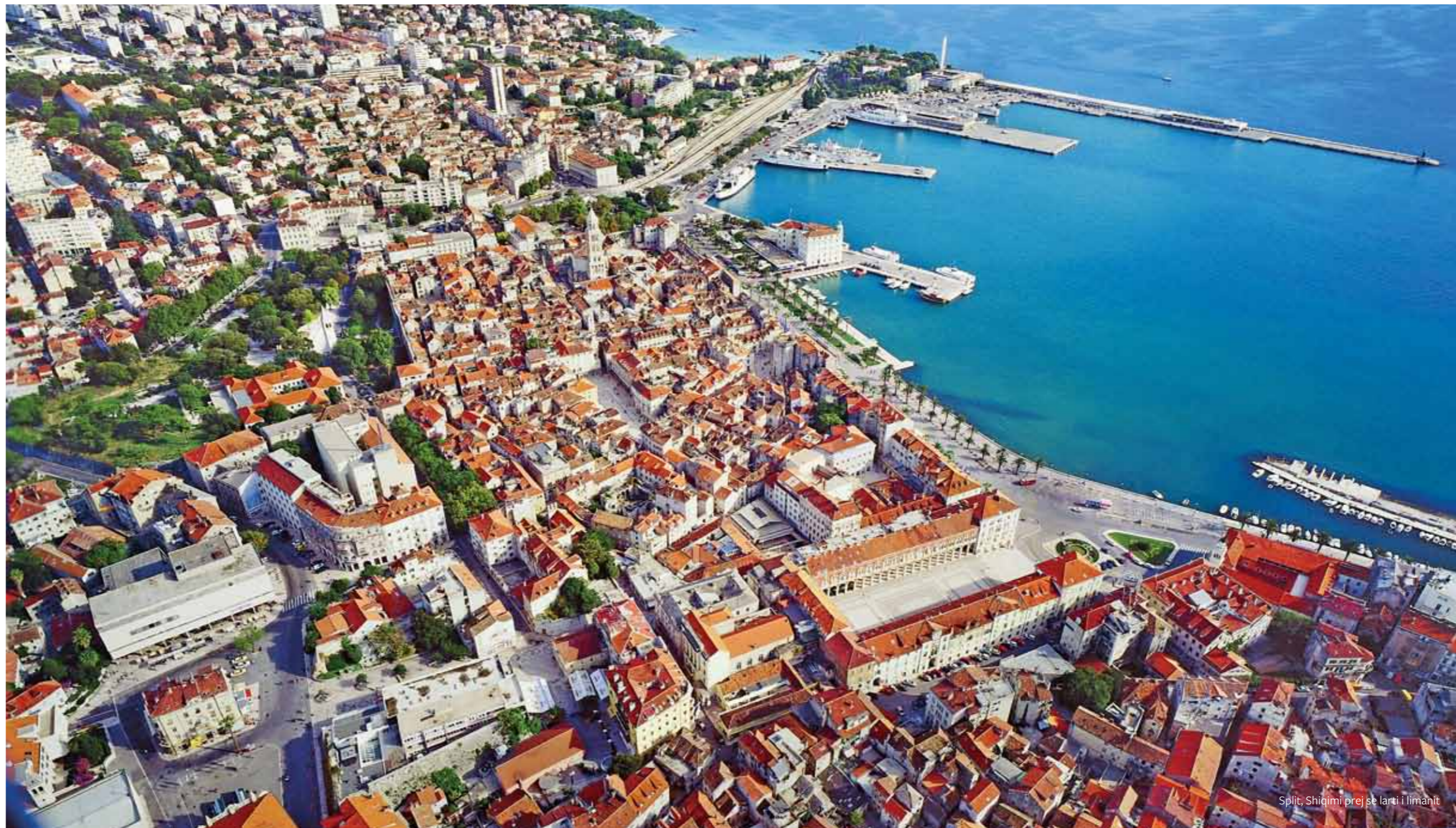
Split, Shiqimi prej se larti i limanit

Vendbanimi Grek Aspalathos i themeluar ndermjet shekullit 4 dhe 3 para Kr. Në afersi te qytetit Salone i cili ne shekullin e 1. p. Kr. Eshte bere koloni Romake dhe kryeqytet i provinces Dalmacija. Reth vitit 295 mbreti Gaius Aurelius Valerius Diocletianus ( i cili ka sunduar prej v. 284-305) ka urdheruar filimin e ndertimit te pallatit te pensionistve afer vendit te tij te lindjes. Ndertesa e ka pase formen e nje kendi te drejt i cili ka perngja nje ndertese me shume kulla nga te tri anet kurse pjesa jugore e kesaj ndertese eshte drejtuar kah deti i hapur dhe eshte e qelur me balkon te futur ne ndertese ndërsa pjesa jugore eshte e hapur me nje balkon te futur ne ndertese me arkada e cila ka zgjatur gjat ter gjatesise. Pallata eshte perbere nga banesa e mbretit, sheshit qendror ( Peristil) ndermjet pallatit dhe ruges kryesore ne drejtim lindje-perendim ( decumanus) i kushtuar vendit me Mauzoleun, tempull, dhe manfukatures tekstile mbreterore ( gynaeceum). Pas vdekjes se Dioklecijanit , Palata ka ngelur ne prone te familjes mbreterore.