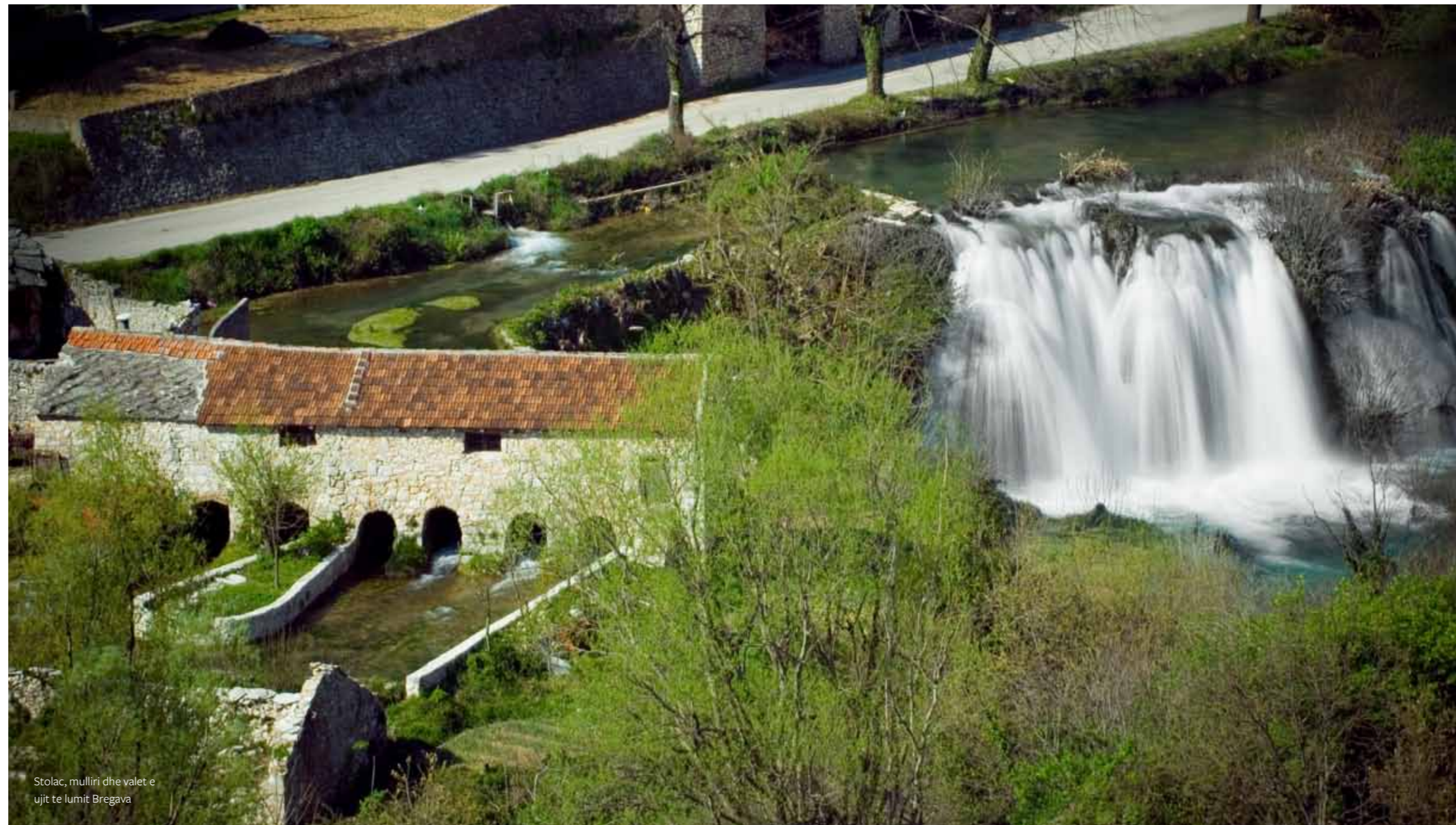
Stolac, mulliri dhe valet e ujit te lumit Bregava

P jesa jugore e Bosnes dhe Hercegovines karakterizohet me nje begati , dhe llojllojshmeri arkeologjike dhe vlerave si dhe trashegemise arkitektonike, si edhe me popullezimin i cili ne disa vende fillon prej kohes se Paleolitit. Mostari , Stolac, Poqitelj , Ljubushki, Blagaj , Zavala dhe blidinje jane disa lokalitete te rendësishme të kësaj zone. Te gjitha keto e kane nje pozit shume te mire natyrore dhe kane pasur nje ndikim te posaqem ne morfologjine urbane. Morfologjia dhe arkitektura autoktone e ketyre qyteteve te formuara ne brigjet e lumejve Radobolje, Neretve, Bregave, Trebizhata, dhe Buna si dhe afer shpelles Vjetrenica dhe liq-ejve te akullit Blidinje, deshmojne me shekuj nje bashkpunim