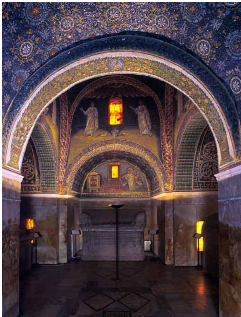
Mauzoleji i Galla Placidia, pjesa e mbrendeshme