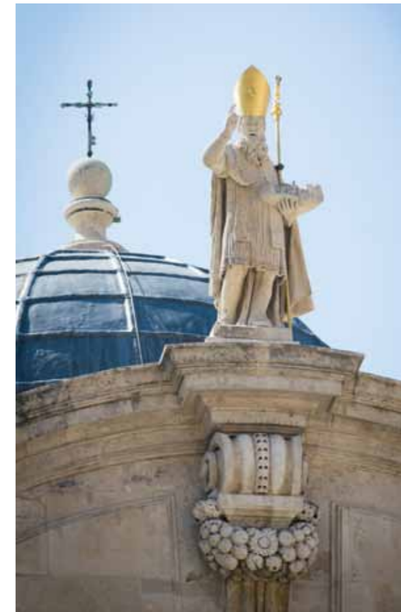
Dubrovnik, Statua e Shen Blasiusit te kisha

Thelbi ( qendra) historike e qytetit me bedemat e qytetit fortesat dhe ngushtica e regjistruar ne vitin 1966 si pasuri kulturore ne Kroaci. Ne vitin 1979 eshte regjistruar ne regjistrin e trashegimise kulturore boterore te UNESCO-s. Jane