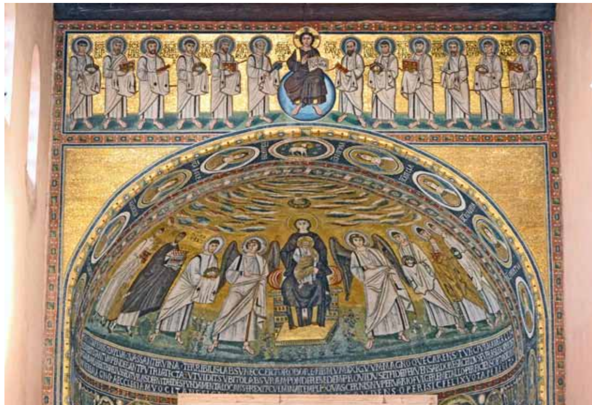
Poreč, Bazilika e Eufrazijanit, mozaiku absidal

në teresin e vlerave të dokumentuara historike nga sejcili detalj, kurse valorizimi modern i permendoreve kujdeset edhe për atë që krejt strukturat, duke i përfshirë edhe ato që nuk shiften (si janë edhe materialet e mbrendshëm të murreve, themelet shtresat e murrin, mbeturinat arkeologjike tragjet a fazes së ndertimit...) kanë një vlerë shkencore dhe dokumentuese. Kesaj duhet shtuar dhe mënyrën e shfrytëzimit të permendoreve i cili edhe sot është në harmoni me qëllimin kryesor dhe burimor.