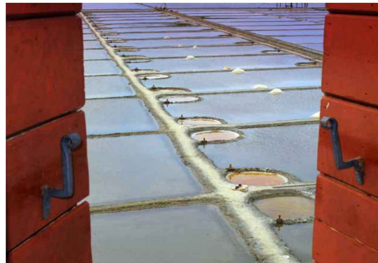
Sečovlje-Fontanigge, Cavedini – fushat e krypes

bletes krypore ( Pseudapis bispinosa ) dhe per shume lloje te insekteve qe hajn bime. Ne kete kalam eshte gjinkalla ( Caliscelis wallengreni ), dhe nje prej sisoreve me te vogel ne bote rotkva shkurtabiqe ( Suncus etruscus ), hardhuca bregdetare ( Lacerta sicula ) dhe lakuriqi me vesh te mbreht ( Myotis blythi ). Bazenat e gjelber jane stacione ku gaforet krypengeres ( Artemia salina ), kurse vendet jo te thela jane shtepi e shume haltheve ngrerese, gaforeve , guacave dhe nje peshku te vogel me vija i quajtur vetullor( Cyprinodon fasciatus ). Ne kete vend jane te vendosura edhe perafersisht