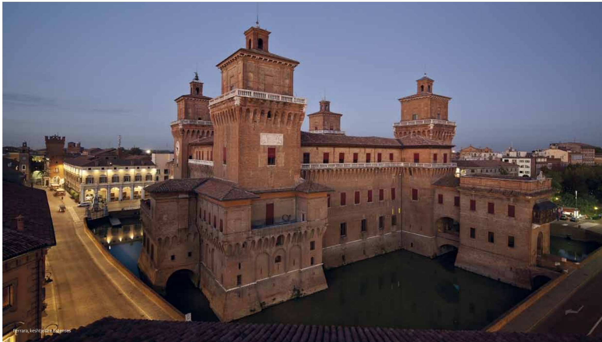
Ferrara, keshitjella e Estenses

Ferrara, nje qendër e rëndësishme tregtare gjat shekullit të mesëm e ka aritur begatinë në renesansë gjat kohës së sundimit të familjes Este. Regjistrimi i qytetit në Regjistrinë të trashëgimisë botërore të UNESCO-s (World Heritage List) lidhet me këtë kohë briljante kurse është kryer me dy faza: herën e parë në vitin 1995 dhe pastaj në vitin 1990. Në mbledhjen e 19 të Komisionit të trashëgimisë botërore (Committee for World Heritage) të mbajtur në Berlin në vitin 1995 qyteti Ferrara është shtuar në regjister sipas kriterijumeve (ii), (iv) dhe (vi) si „ lokalitet me vlera të jashtëzakonshme univërsale, jashtëzakonisht i planifikuar si qytet i renesansës ku thelbi urban i tij është ruajtur kryesisht i pa prekur. Arritjet në planifikimin urban të trupësuar në Ferrari kanë pasur një ndikim të thellë në zhvillimin e skemës urbane në shekulljt