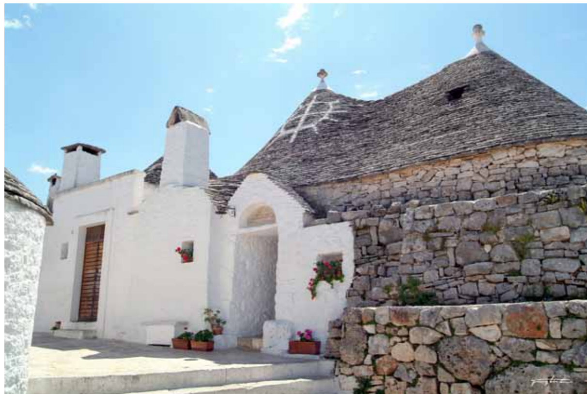
Alberobello, Trullo me simbol ne kulem

vetem fuqija puntore e aftesuar , shume e paket ne kete kohe per faktin se edhe ketu si edhe ne vende tjera njohja e tehnikes se ndertimit me gurre palidhese me stuk e nderon tehnologjija moderne e bazuar ne mekanizmat e reja. Mirpo kjo teknik e ka terhekur vemendjen e bashkesise nderkombetare shkencore per tekniken e murrin te that dhe prodhimin ne tentim qe te caktohen menytrat e ruajtjes se shkathtesive ndertimore.