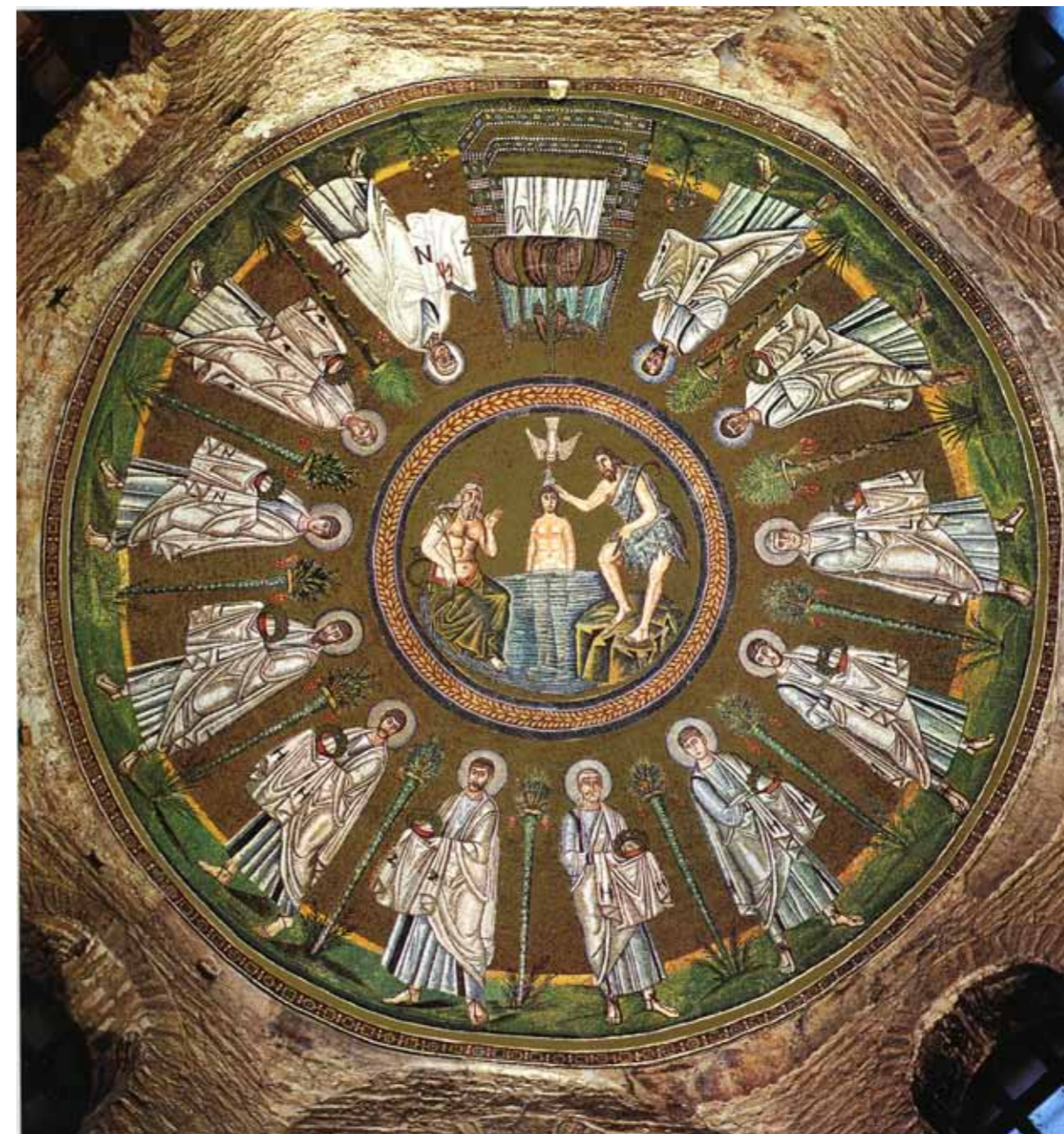
Ravenna, Pagezimorja e Arijaniteve, mozaiku në kupolë

Është ndërtuar kah fundi i shekullit 5. gjat sundimit të Teodorikut kur kulti i Arijanitëve ka qenë religjioni zyrtar i oborit mbreteror, pagzimorja ka bazën tetkëndeshë dhe përmbanë mozaikë të bukura nga kalimi prej shekullit 5 në shekullin e 6. Mozaiku bukur në kupolë tregon pagezimin e Krishtit në lumin Jordan dhe dymbdhjetë Apostujt. Sipas doktrines arianite Krishti ka qenë i Biri i Zotit, por e ka mbajtur natyrën njerzore. Këtu Apostujt ku në duar mbajnë uruza të jetës-lavdisë –fitores si në pagzimorën tjetër, nuk janë ndarë nga shandani i madh (kandelabri) si simbole të dritës, por vetëm me palma që simbolizojnë