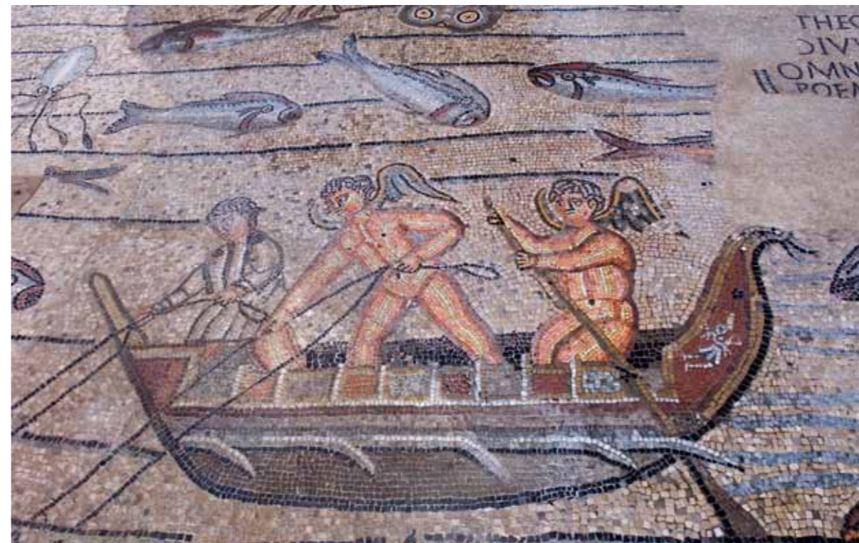
Aquileia, Tregimi i biblese Jonah (Bazilika, mozaiku perdhese)

zaqet permbrenda kishes dhe rezidences ipeshkvnore. Ne pjesen e lart mund te shifen mbeturinat e katedrales post Teodorijane me nje pagzimore te re. Eshte ndertuar ne shekullin e katert per ta nderuar kishen e Teodorikut.