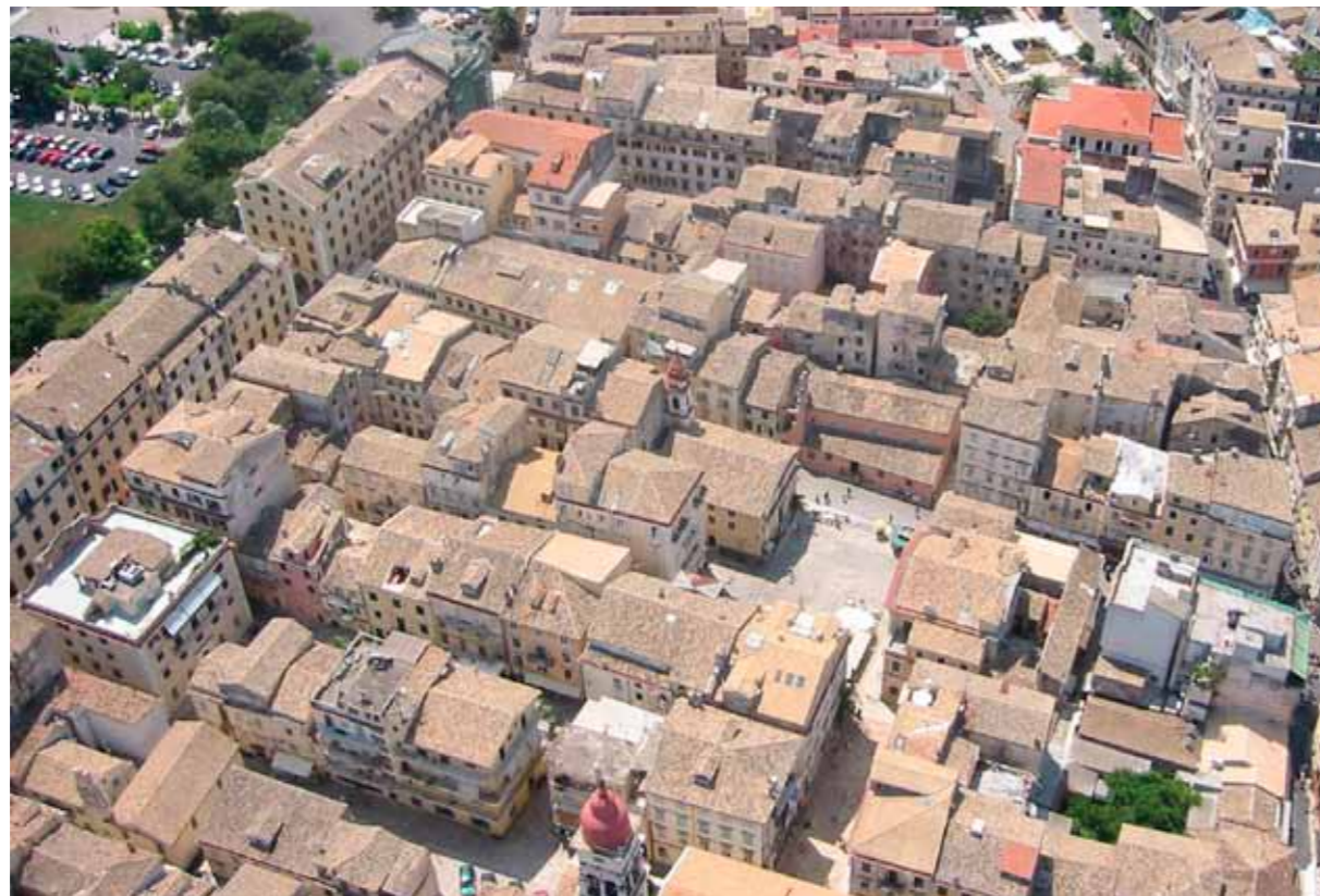
Corfu, qendra e qytetit

pjesë historike të qendrës së qytetit e përfshinë Sianada (esplanada) e cila shtrihet ndërmjet Fortifikatës së vjetër dhe zonës së ndërtuar e cila deri të madhësia e sotme ka arritur duke i prishur dhe rezuar shumë ndërtesa përshkakë të mbrojtjes në vitin 1628. Spianada, sipërfaqja me e hapur për mbrenda lokalitetit, është i mbjellur me lisa dhe kopshte dekorative nga shekulli 19dhjet dhe është ngushtë i lidhur me historinë e qytetit. Deti dhe lisat, pyjet, fushat e ullirë ve dhe pejsazhi tjetër vegjetativ për rreth qytetit janë shumë faktor të rëndësishëm të kësaj ambijenti natyror. Disa karakteristika të zonës së mbrojtur ngushtë janë të lidhura me historinë e