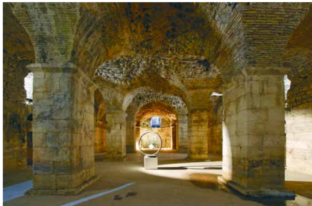
Split, Pallati Dioklecianit, Podrumet

e kores ( vend ne te cilin lutet dhe kendohet breviari) eshte renovuar teresisht dhe vemendja eshte kushtuar ne elementet e shkatruara arkitektonike te kohes se barokut. Ka filluar pastrimi laser i pjeses se perparme e cila vazhdon ne pjesen e mbrendeshme te murreve dhe kupoles ( mbulesa e kesaj ndertese) e ndertuar me tulla. Ndriqimi i ri e mundeson nje perjetim me kompleks te Katedrales. Shume pune te restaurimit zhvilloen mbrenda Katedrales.