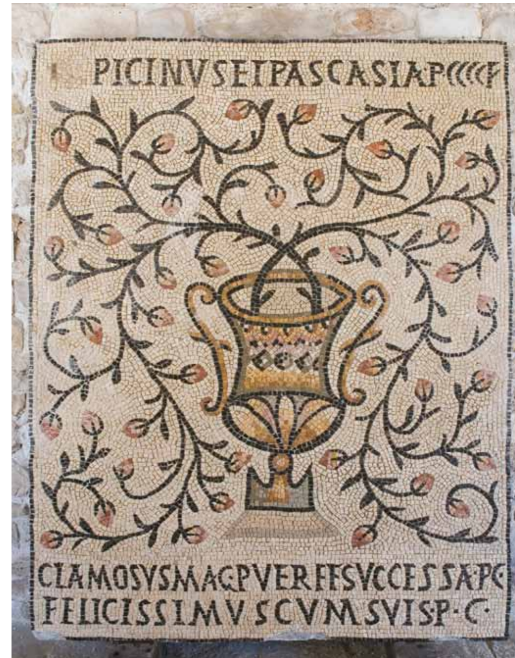
Poreč, Bazilika e Eufrazijanit, mozaiku i dyshemes