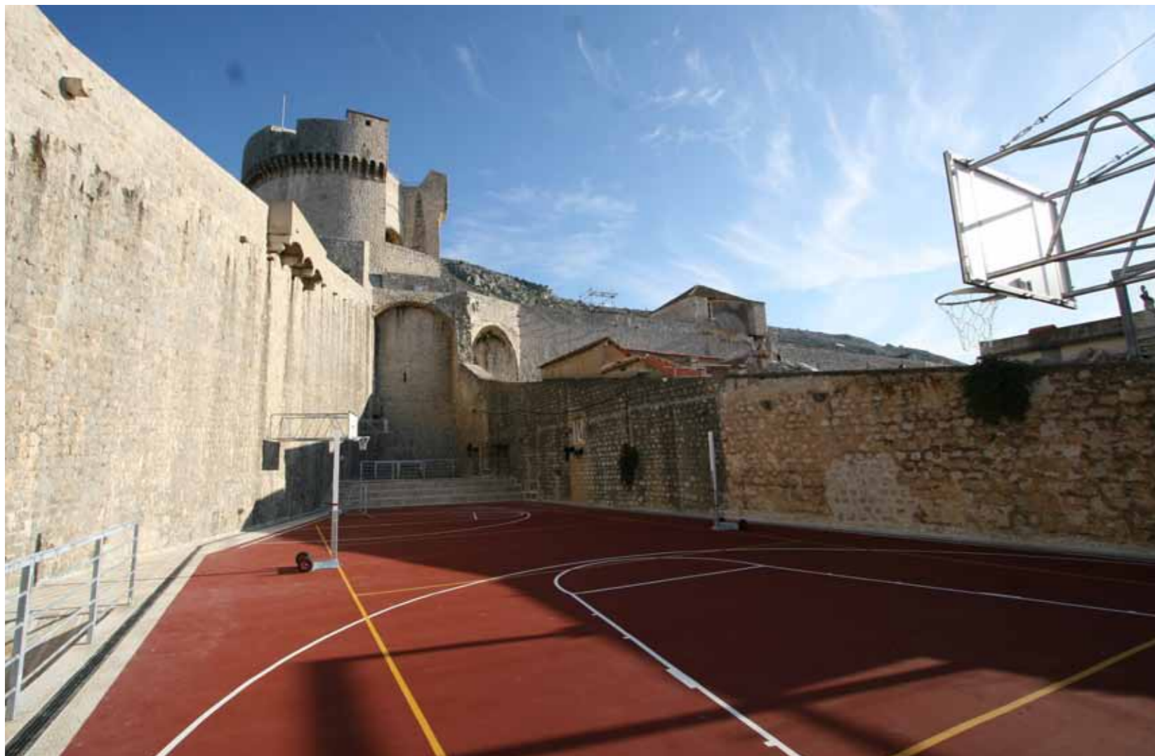
Dubrovnik, kulla e Minqetes