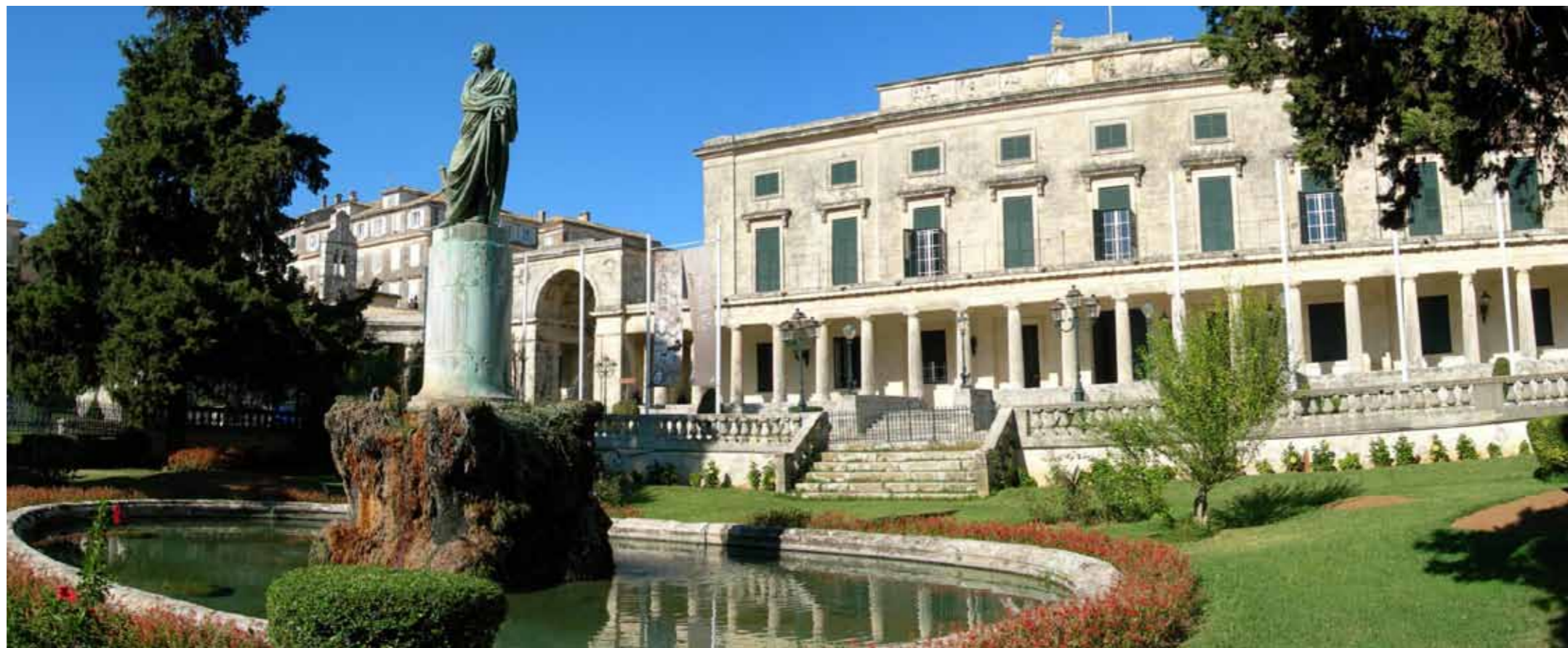
Corfu, Pallati i Shen Mikelit dhe Shen Gjergjit

e teresise eshte fituar me punimet ne shekullin 19dhjet dhe 20. Autenticiteti dhe teresija urbane e Indit lidhese kane te bejne para se gjithas me qytetin neoklasik. Per gjegjesine per mbrojtjen e qytetit e ndajne disa institucione ne baze te vendimeve te ndryshme, duke perfshire Ministrine e Kultures te Greqise ( vendimi I ministrise nga v. 1980), Ministrija per ambientin dhe planifikim hapsinor dhe punet publike ( Vendimi I kryesise nga v. 1980) dhe komuna Kerf ( Vendim kryesise nga v.1981).