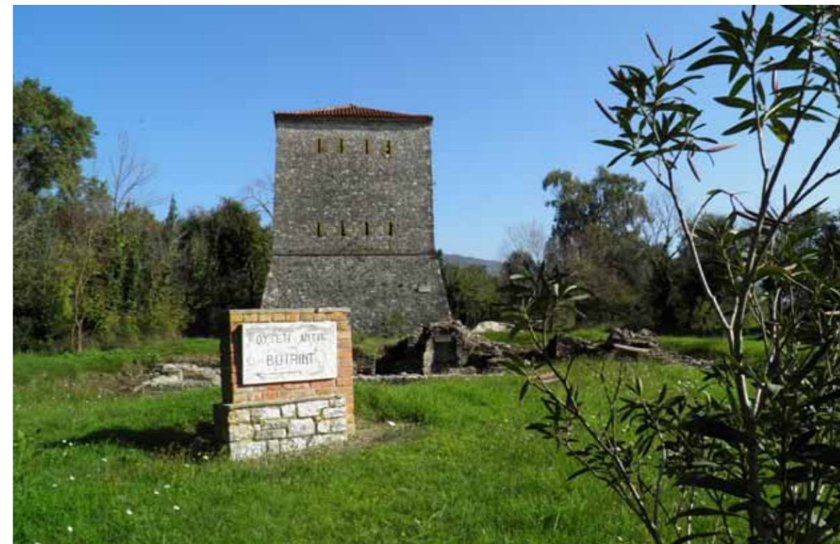
Butrint, kulla mbrojtëse

greke. Ne fillim ka pasur shume pak teatra. Jane zgjeruar ne shekullin e III. p. Krishtit kurse vendet e publikut ( cavea) jane zgjatur deri te ndertesat e trezorit. Renditja e uleseve eshte organizuar ne menyre hiererarhike keshtu qe uleset me afer skenes kane sherbyer per qytetaret me te shqar. Ne Butrint rendi i pare i uleseve ka pase banka ne kembet dhe kane qene te dekoruara dhe vizatuara me shuplakat e luanit, kurse karikat e fundit kane qene te bera nga bloqet e thjeshta. Performanset nuk jane mbajtur ne pjesen e rafsht qarkore ( orchestra) , por ne sqenen e ngritur( scaenae frons). Sqenat diku gjat kohes se Romes jane pertrire intenzivisht dhe skenen e bejne ma te lart me se paku dy kateshe. Tre vende