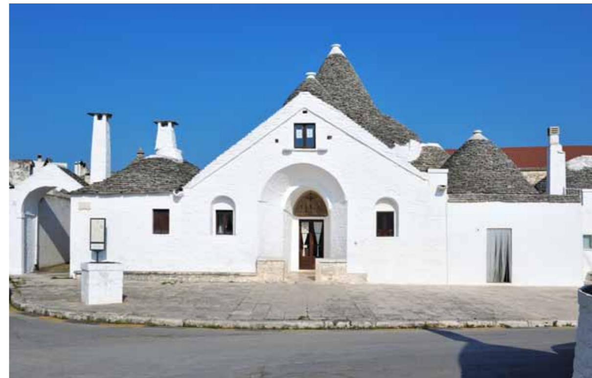
Alberobello, Trullo Sovrano

Regjistrimi i trullave ne Alberobello ne regjistrin e trashegimise boterore te UNESCO-s ( World Heritage List) ne baze kriteriumeve kulturore ( iii), (iv), (v) ne dhjetore te v. 1996 Qendra per trashegimin boterore ( World Heritage Centre) e ka aresyetuar ne kete menyre: „ Lokaliteti ka nje randesi te jashtzakonshme univerzale se nje shembull ekskluziv i formes se konstrukcionit ndertimore me prejardhje prej teknikave ndertimore parahistorike te cilat jane te pademtuara dhe e kane pritur boten moderne“.