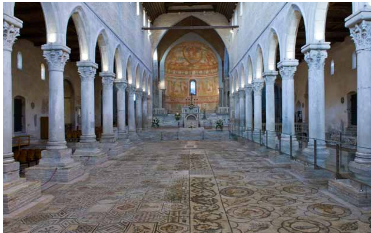
Aquileia, mozaiku perdhese ne Bazilike

publikun) dhe lokaleve te ndryshme te cilat kane mujtur te i takojne rezidences ipeshkvenore. Mozaiku ne pjesen jugore te sales se Teodorit me siperfaqe reth 760 m kateror eshte dyshemeja mozaike me e madhe ne pjesen Perendimore te Perandorise Romake. Me dysheme jane te ndara 4 lokale ne hapshire te teresishme ku dominon mbishkrimi i kushtuar Teodorikut. Paraqitjet alegorike te trilluara ( imagjinuara) me domethenje te fshehura kane sherbyer si udheheqes ne drejtim te shpetimit per jete e mot.