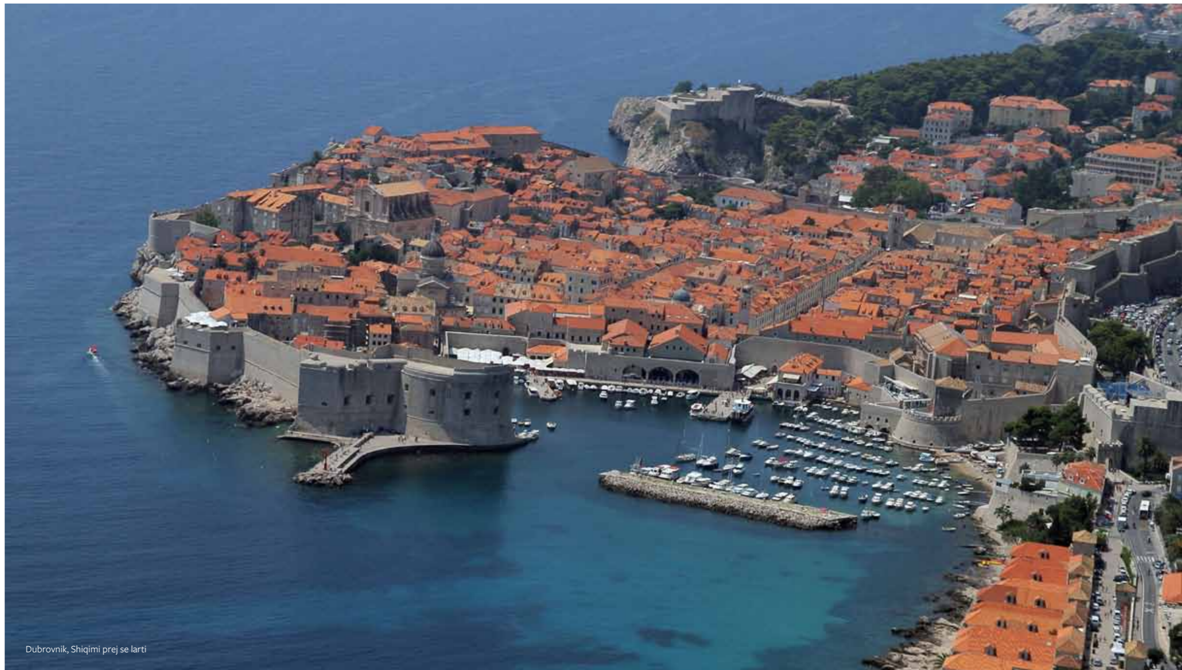
Dubrovnik, Shiqimi prej së larti

Dubrovniku është qender ekonomike, arsimore dhe kulturore e Dalmacisë së jugut dhe qender administrative e prefekturës Dubrovnikase-Neretvane. Fillimi dhe historia e ndërtimit të mureve të qytetit përputhen me fillimin e historisë së zhvillimit të vet qytetit Dubrovnik ose Qytetit të shkruar me germen të madhe filestare si edhe e quajnë qytetaret e tij. Në të vertet, muret e tij kanë qenë gjithmonë conditio sine qua non , që e shqipton dhe në mënyrë shekullore deri në ditët e sotme e feston mbishkrimin i njohur në derën hyrëse në kështjell Lovrijena: Non bene pro toto libertas venditur auro- lirija nuk shitet për asnjë ari të botes. Lirija ka qenë ideal i Dubrovnikut i cili është aritur dhe i ruajtur gjat shekujve. Kështu që në flamurin e Republikës së Dubrovnikut shtetit të shekullit të mesëm qendra e së cilës ka qenë Dubrovniku është shqiptuar mbishkrimi „Libertas“.