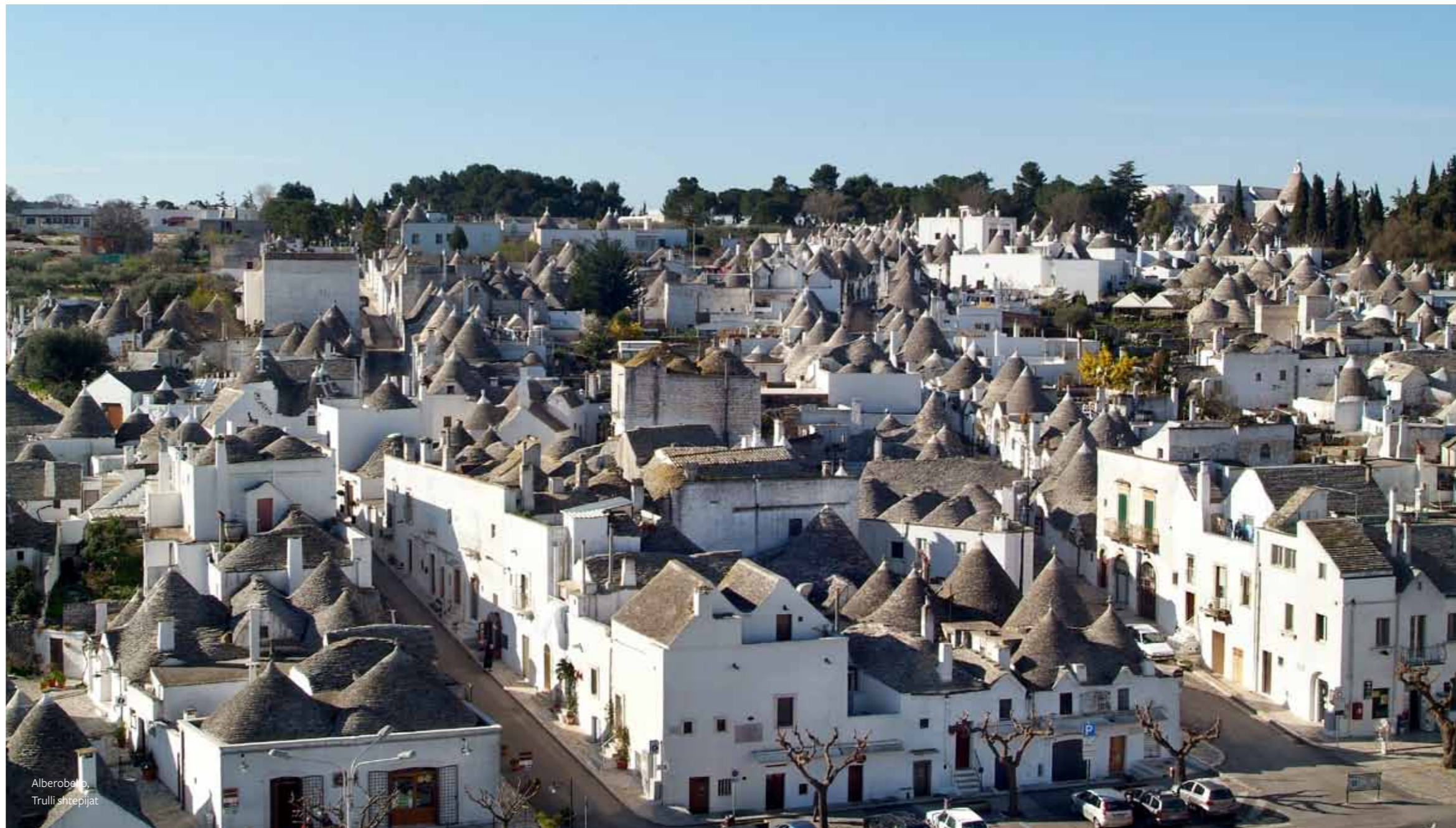
Alberobello, Trulli shtepijat

T rulli janë ndertesa të popullates se thjesht me nje form kateraneshe, te mbuluara me kulme qe kane formen e nje hinke, te ndertuara me perdorimin dhe perpunimin e gurëve masive ne menyre te vrazht gellqeror te mbledhura ne fushat per reth. Kur ne kohen e me vonshme ne kete zone jane ndertuar rezervuaret e mdhenje per rezervimin e ujit, trulli jane ndertuar direkt ne shekëmbin e gjall ekskluzivisht me nje teknik te murrir te that pa perdorimin e malterit( laq fasade). Ato jane nje afirmim i veqant arkitektonik: nga njera ane ka lindur ne traditat e bazuara teknologjike dhe tipologjike te vjetra nga koha parahistorike e cila ne kete pjese te Italise se Jugut kane mbijetuar pa nderprer. Nga ana tjetere rethanat e panjohura kane arritur qe keto teknologji te shtrihen gjeografikisht ne kohen e caktuar precize ndermjet shekullit 17.dhe fundi i shekullit 18. Bashkimi i dy ose me shume trullave te madhesive te ndryshme formon nje vendbanim. Numer i madh i te lidhura ndermjet