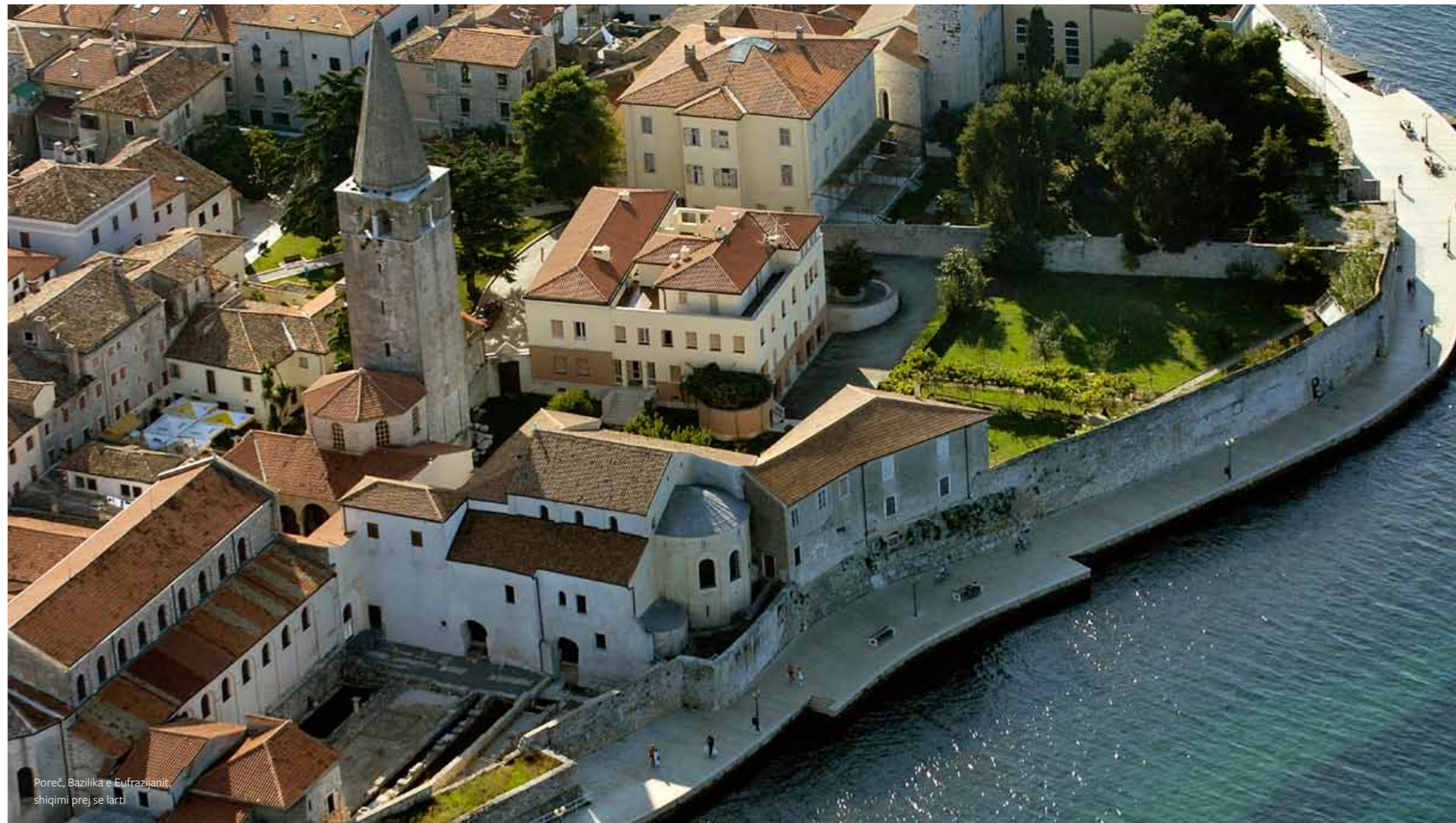
Poreč, Bazilika e Eufrazjanit, shiqimi prej se larti

P arentiumi Romak, sot Poreč, e kane themeluar Romaket ne gadishullin i cili shume heret ka qene pak i banueshem. Qyteti i vogel Romak e ka pas nje rrjet te regullt te rrugeve katerkendeshe , karda dhe dekumana ( rruget kryesore te stilit Romak , karda e ka pas orijentimin prej verijut kah jugu, kurse dekumana ka pas orijentimin prej lindjes ne perendim)te cilat ja kane dhene formen e bloqeve te banesave dhe ndertesave publike. Forumi ka qene ne majen e gadishullit, kurse ne anen verijore ne shekullin e tret eshte formuar nje strukture-nderlidhje e Kristijanizmit te hershem ne shekullin IV e ka fituar formen e nje kiske publike. Ipeshkvit i Porecit Eufrazije me temelj e ka renovuar ne shekullin e 6 nderlidhjen e atëhershme te Katedrales dhe baziliken e madhe e ka furnizuar me mozaqe luksoze te murrit .