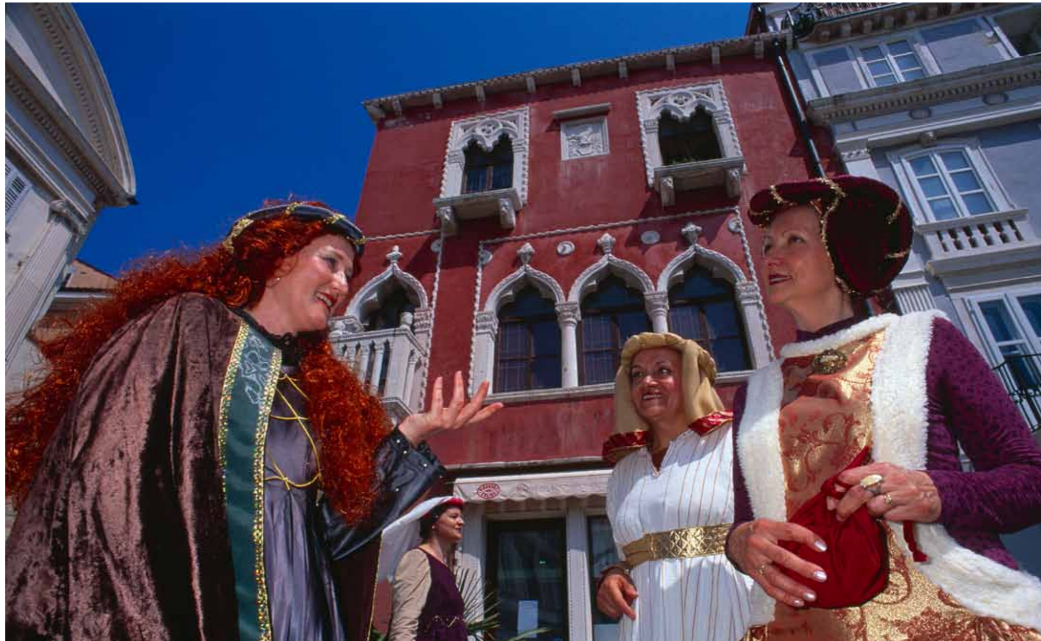
Piran, Pallati i Venedikut

Pirani ne burimet e shkruara per te paren her permendet ne shekullin e 7.bashk me qytetet tjera te Istres ( Ravennatis Anonymi Cosmographia ). Duket se jeta ne qytet eshte e zhvilluar ne menyre kontinuitive, duke e ndruar vetem pushtetin: Ne shekullin e 7. nën sundimin Bizantine, kurse ne gjysmen e dyt te shekullit 8.bashk me Istren ka ra nen sundimin Frankofon, kurse ne v. 952 eshte perfshije nen mbretine Gjermane si pjese e Markes Furlane. Pas v. 1209 patriarku i Akvilejes eshte bere sundues si markgrof i Istres. Periudha relative e pavarise eshte kryer ne vitin 1283 kur Pirani eshte nenshtuar pushteti Venedikas. Gjat, qet dhe nje periudh e volitshme te pushtimit Venedikas eshte kryer ne v. 1797 me shkatrimin e Republikes se Venedikut. Pas kesaj Istra dhe Pirani behen pjese e Kustenlandit ne nderlidhje (strukture) te Mbreterise Austrijake, gjegjesisht Mbreterise AustroHungareze krejt deri ne v. 1918. Pas mbarimit te luftes se pare boterore kjo zone-krahine eshte bashkangjitur Mbretnise Italiane. Qyteti pas luftes se II. boterore ka qene pjese e Zones B. te Teritorit te lire te Triestes ( 1947-1954), kurse ne suazat e memorandumit te Londres ju eshte bashkangjitur Jugoslavise. Pas 1991 eshte ne perberje te Republikes se Slovenise.