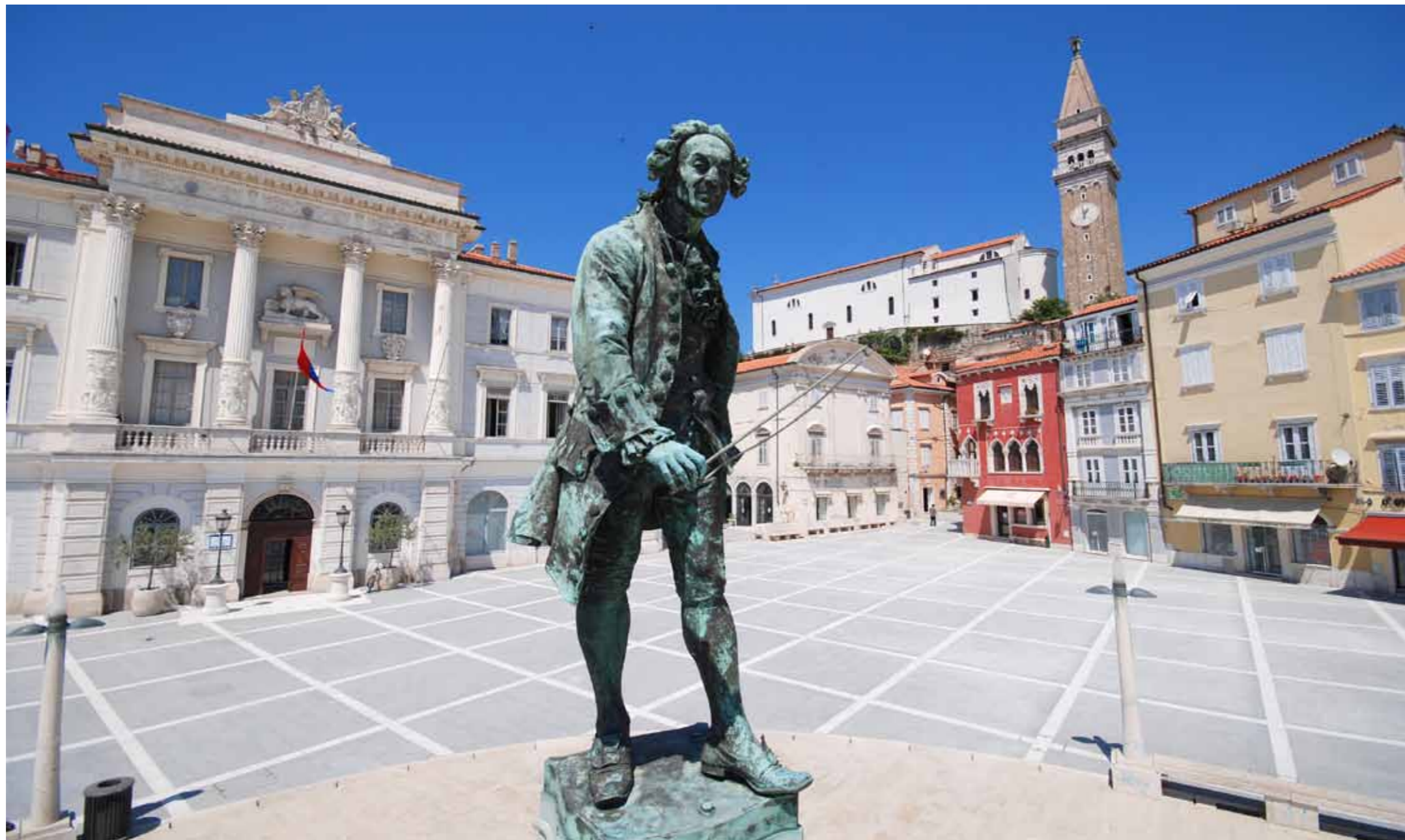
Piran, Statuja e Giuseppe Tartini ne sheshin kryesor

prej Kranjit, Korushkes, Shtajerskes, dhe Krasit dhe Furlanise, prej Holandes dhe prej Turqise.