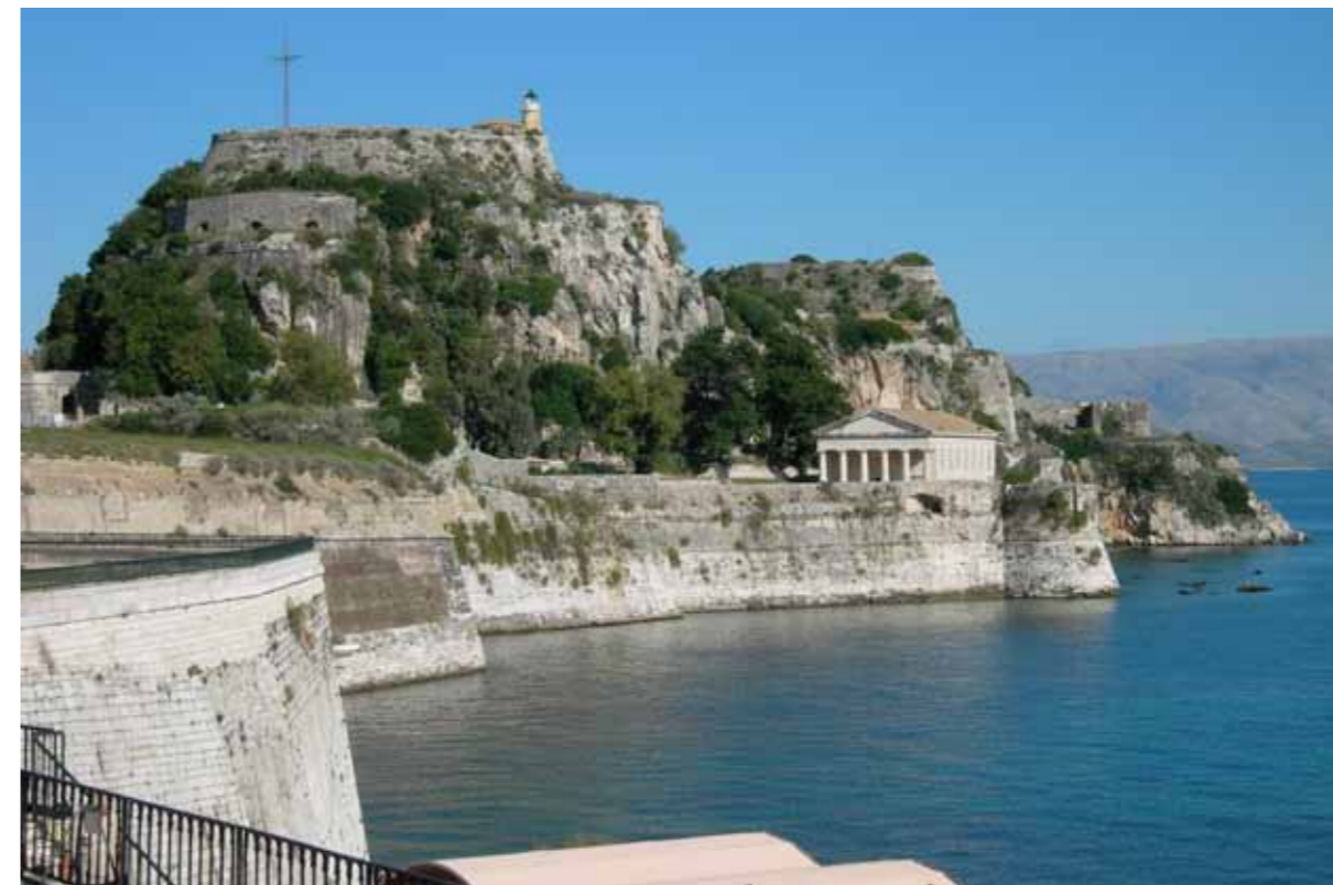
Corfu, Fortifikata e vjeter

Me paqen ne Campo Formiu ( 1797) eshte vulosur fundi I Republikes se Venedikut kurse Korfuzi bjen nen administratimin Franqez ( 1797-1799) , kjo zgjat deri te terhjekja e Franqezve para aleances Ruso-Turke te cilen e ka themeluar Shtetin e bashkuar te ujdhesave te detit Jon, me qytetin kryesor ne Korfuz ( 1799-1807). Percaktimi I kufive teritorijal ne Evrop pas sulmit te Napoleonit pas nje periudhe ndermjet te pushtetit te rij Franqez ( 1807-1814), e kane formuar Ko-