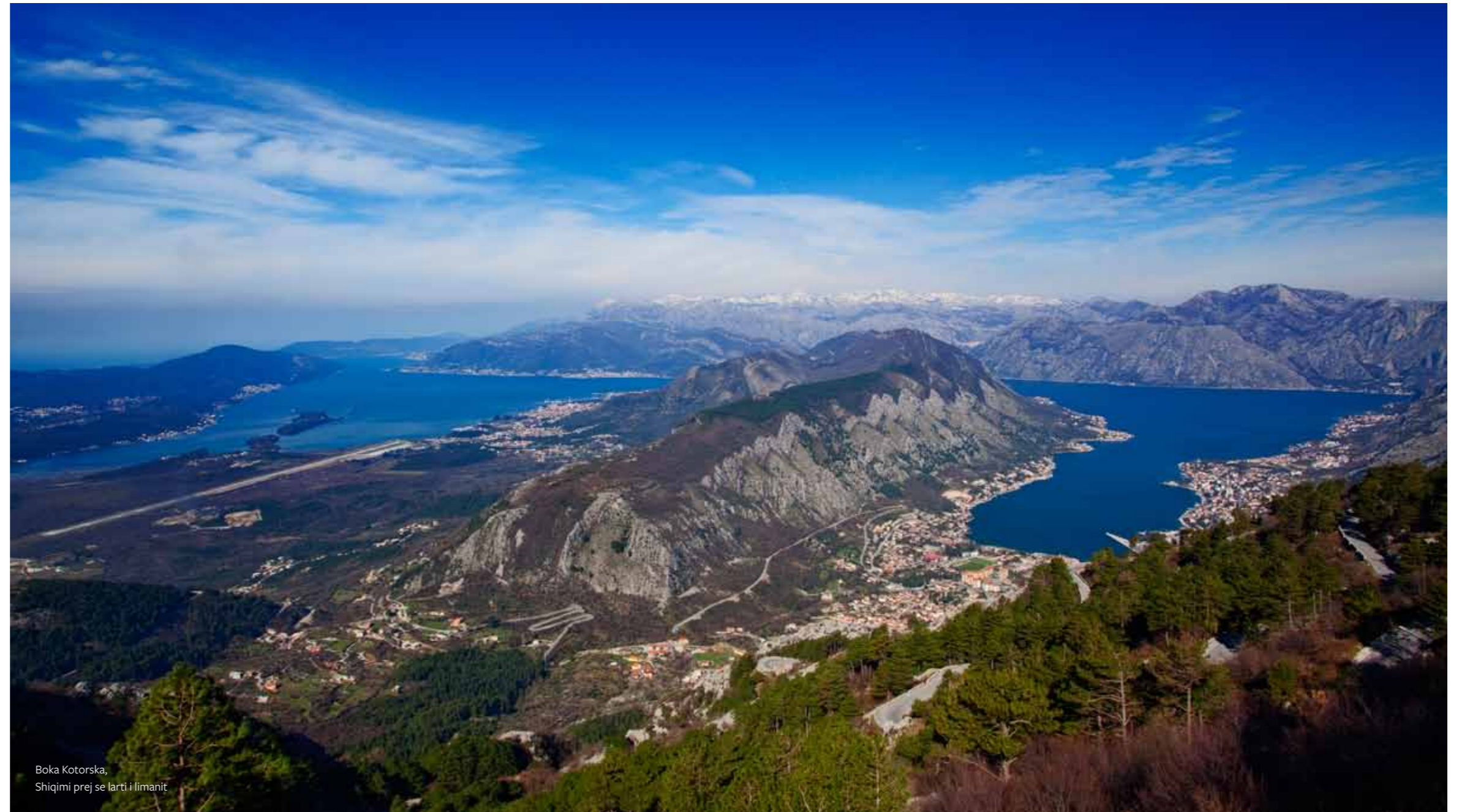
Boka Kotoraska, Shiqimi prej se larti i limanit

R ethina natyrore , historike dhe kulturore e rethines se Kotorit eshte pjese perberse impresive e Gjiut te Kotorit, nje lima shume natyror ne pjesen lindore te bregdetit Adriatik te Malit te Zi . Duke ju falenderuar nje vlere univerzale dhe te jashtzakonshme, eshte klasifikuar ne regjistrin e trashigimise boterore te UNESCO-s ne vitin 1979. Definicioni i ndikueshem i kesaj rethine me 2011 e ka perfshire krejt gjirin. „ Rethina natyrore, historike-kulturore e Kotorit“ perfaqeson nje kombinim harmonik te llojllojshem te fenomeneve natyrore dhe trashegimise se ndertuar. Gjat gjijut Kotor-Risan , eshte pjese perberse e rethines se mbrojtur , Gjiu i Kotorit gjithashtu e perfshin edhe Gjijun e Tivarit dhe gjirin e Hercegnovit. Me karakteristikat e llojllojshme dhe te shumta natyrore , gjeografike , historike dhe shenimeve kulturore, gjiu i Kotorit perfaqeson nje pejzazh te vleres se pergjithshme dhe te jashtzakonshme.