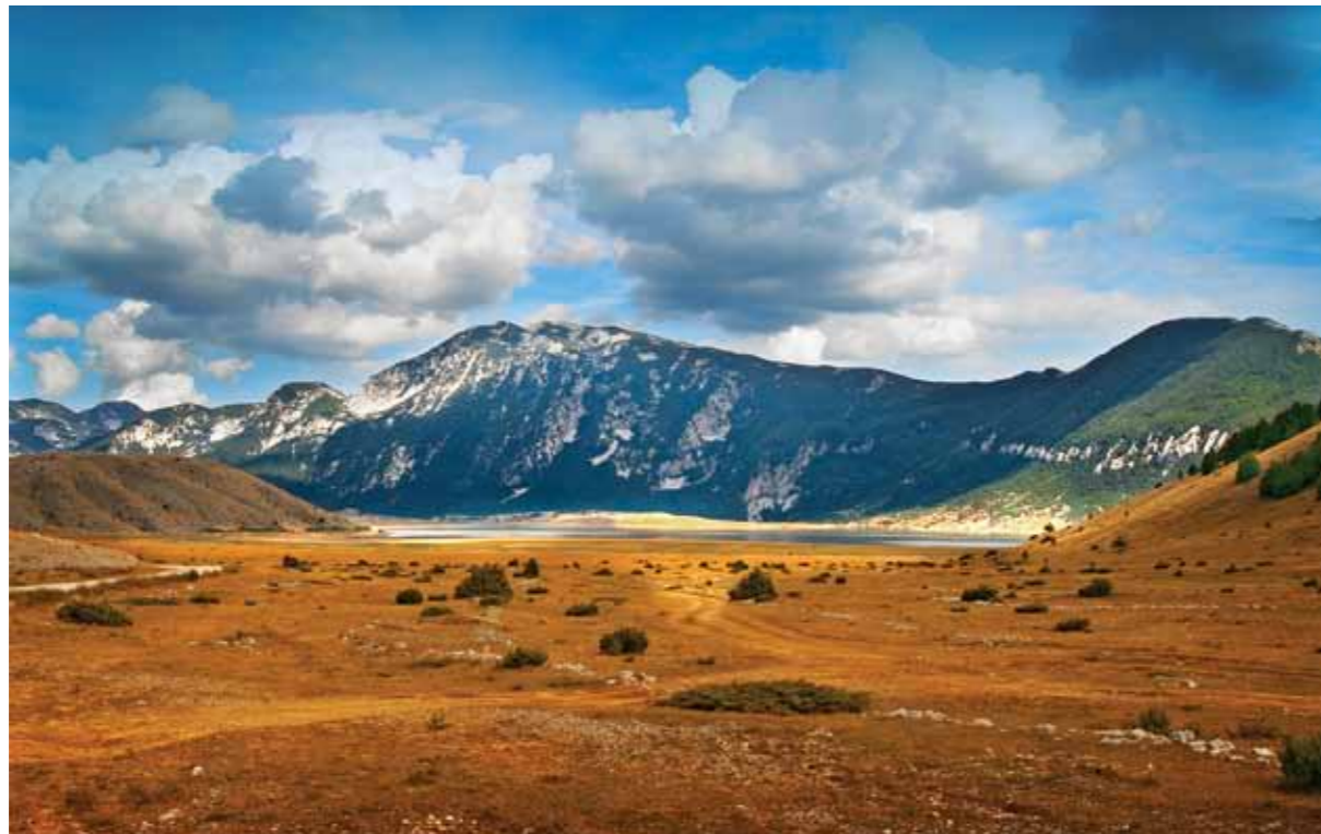
Blidinje, liqeni dhe nekropola mesjetare

te njerijut dhe natyres. Rendesine e ketyre lokaliteteve te numruara mesiper e ka njohur edhe UNESCOja duke i regjistruar ne regjistrin e trashegemise boterore ( World Heritage List) ose Listen e kandidatve( Tentative list).