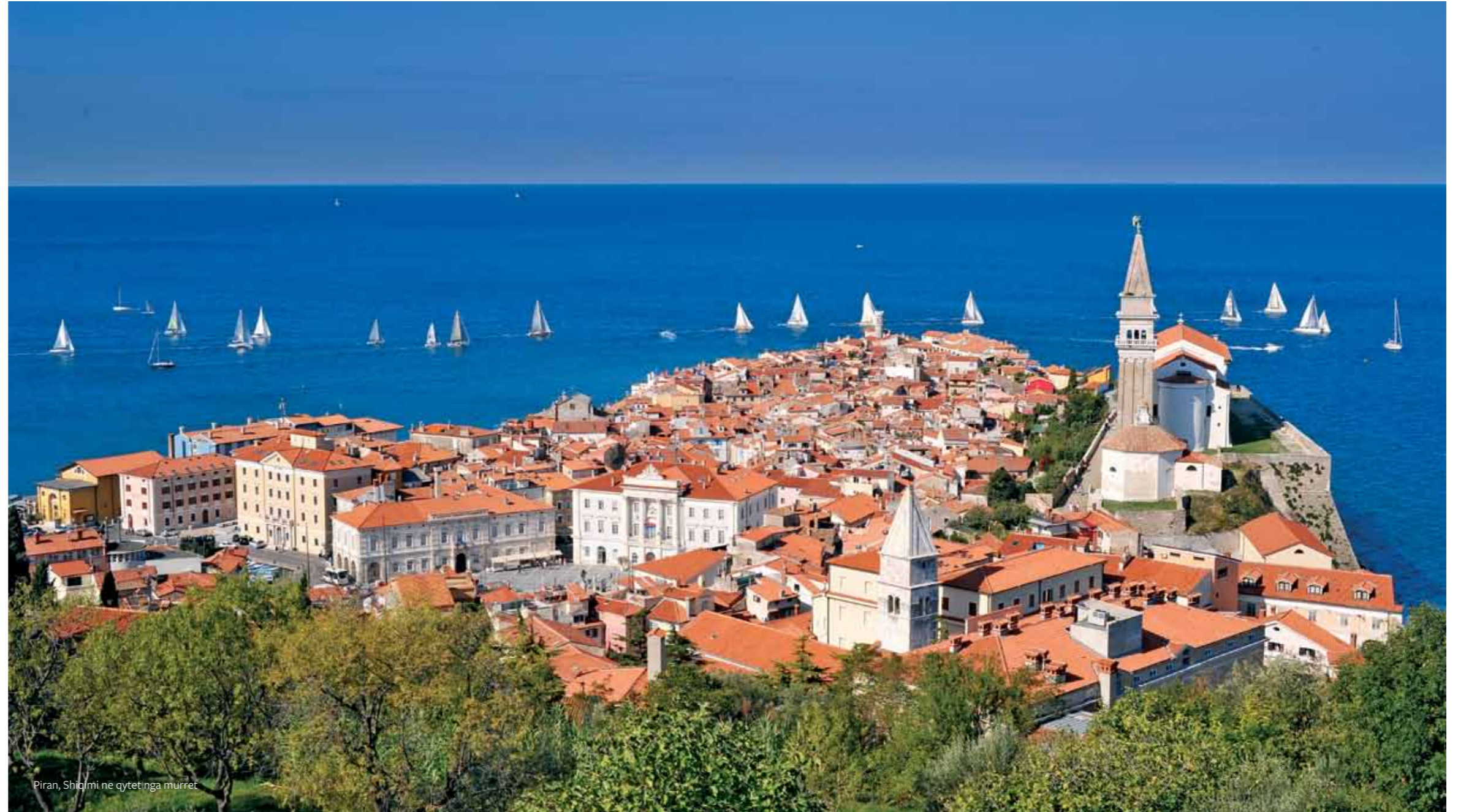
Piran, Shikimi ne qytet nga muret

Pirani me thelbin e vet te qytetit e vjetër dhe kryporet perfaqeson nje permendore te rendesishme te trashegemise se pasur arkitektonike dhe nje pejsazh unik i kultures se krypes te cilat edhe sot jane duke punuar prodhimi bazohet ne kultivimin tradicional. Instituti per trashegemine e Mediteranit i qendres hulumtuese – shkencore te universitetit Primorska, ne bashkpunim me komunen e Piranit dhe institucionit per mbrojtjen e trashegemise pergatisin nje baze profesionale per nominimin e qytetit te Piranit dhe rethines se tij natyrore per hyrje ne regjister te UNESCOs. Gadishuli i Piranit ka nje pozit shume te mire –shkrep malor ne pjesen verijore i cili e mbron qytetit fortuna , dhe shkembi i pjeret si dhe gjiri i detit ne pjesen lindore mundesojne nje pamje te mire mbi hyrrjen e vetme nga pjesa tokesore, per kete shkak edhe ka qene i banueshem qysh ne kohnat parahistorike. Ne pjesen e bregut te detit te ceket reth kepit Madonna eshte zbuluar nje thike prej gurrit nga koha e bronzit, kurse ne sheshin e vjeter te qytetit jane zbuluar disa gjera nga koha