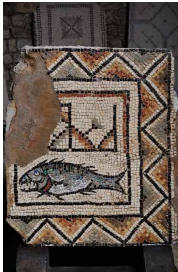
Poreč, Bazilika e Eufrazijanit, mozaiku i peshkut

Shenjëtorja e re troapsidale ne pergjithesi eshte e mbuluar me nje kompozim mozaikal te madh. Programi ikonografik i apsidave kryesore perbehet nga paraqitja e Krishtit me apostujt ne kendin triumfal, shume medaljona me portretet e shenjtorve ne kendet triumfale si dhe pikturave te mdha ne vet apsiden. Ne kalot eshte paraqitur Krishti te cilin e mban Zoja ne fone, anash janë engjujt dhe shenjterit martir. Ne mbishkrim eshte potencuar Shen Mauro , mbrojtësi i qytetit. Ne percjellje te shenjtorëve dhe engjujve jane paraqitur edhe ipeshkvi Eufrazije me modelin e Bazilikës ne duar , xhakoni ( aj qe ndjek nje shkolle fetare per prift) Klaudije dhe djali i tij Eufrazije.