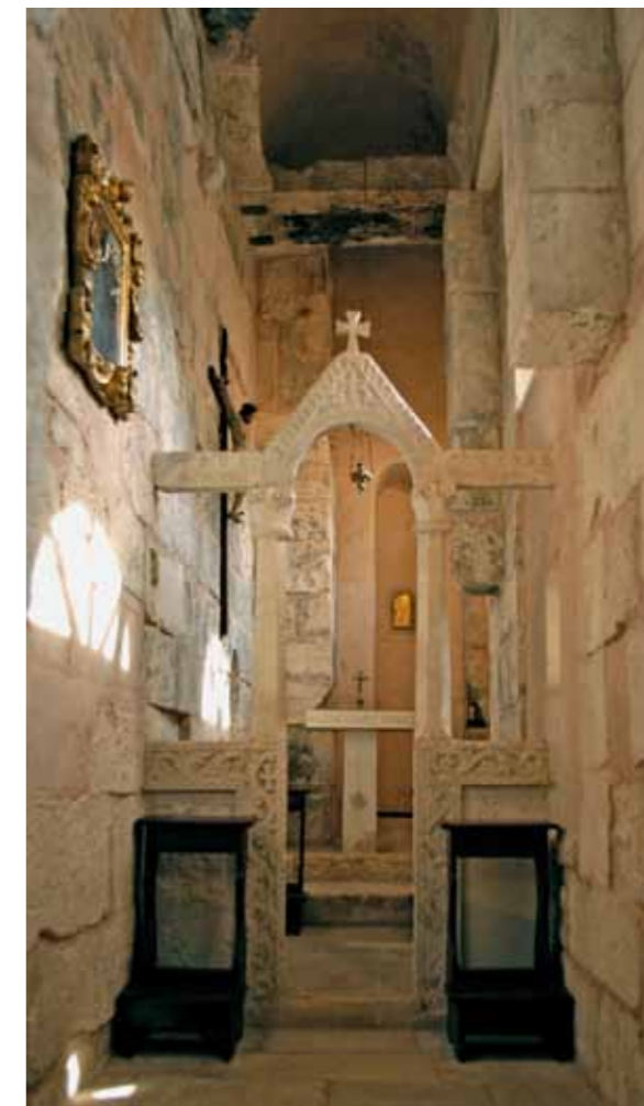
Split, Pallati Dioklecianit, Kisha e shen Martinit

mese te tre dhe 6 tonelatave jane quar per shkak te korodimit te ferrave ( rrethoj, ka reshqitur ne menyre te pjeret kulmi trekendesh dhe eshte kthyer kah pjesa e jashtme). Renovimi i tempulit eshte bere me kombinimi e teknikave tradicionale dhe me perkrahjen moderne te logjistikes. Eshte bere 3-D modeli kompjuterik e analizes strukturale. Per ta ndalur levizjen e metutjeshme te struktures dhe shkatrimin e shpejt te gureve dhe te behet ngarkesa stabile dhe renditja burimore kulmi tregendesh, perendimor dhe nje pjese e kurores se gurrit ka qene dashur te demontohen dhe te renovohen duke shfrytezuar metodat tradicionale dhe te kthehen ne vend. Ferrat e hekurit ( shkure gjembore jane nderuar me elemente nga qeliku qe nuk ndryshket dhe jane mbuluar me plumb ne menyre tradicionale. Dekorimet e gedhendura mire te portalit ( hyrje kryesore ne kisha) dhe larime ne njeren ane jane pastruar me laser.