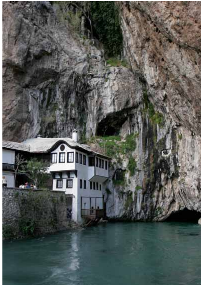
Blagaj, Tekke (tekija) ne lumin Buna

Teresine arkitektonike te Stolcit e krijojne nënt shtresa historike: koha parahistorike, iliriko-romake, shekulli i vonshem i mesem , koha Otomane, periudha Austro Hungareze si dhe Jugoslavija e pare dhe e dyt. Deshmite me te mira materijale te pejsazhit te qytetit zbulojne shume ndikime te llojlojshme ne arkitekturen e qytetit mjaft kontradiktore dhe te perbashkta , ligjeshmerise dhe paradokseve, planifikimit dhe natyres se persosur te cilat krijojne nje pamje te ketij qyteti te vlerave te jashtzakonshme dhe univerzale. Qendra historike e Stolcit eshte e hapur dhe lehte e kuptueshme ne shiqim te pare dhe ofron nje rast dhe nje shiqim te lehte kulturor te ndikimit me pak se kater mbreteri ( Romake , Bizantine, Ottomane dhe Austrohungareze) tri mbreterive ( Bosna, Hungarise, dhe Jugoslavise)si dhe tri religjione monoteistike: Kristijanizmi ( Orthodox dhe Katolik) Islamit dhe Judaizmit , te cilat kane krijuar stile te llojlojshme arkitektonike dhe adete per mbrenda qarqeve kulturore te cilat definoohen si Mediterane, Mes evropjane , Euro perendimore , Bizantine, Balkanike , dhe Ottomane. Mirpo edhe pse eshte kjo llojlojshmeri thelbi i qytetit Stolac eshte nje harmoni e