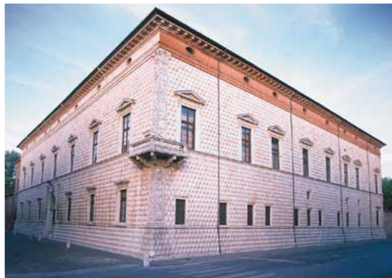
Ferrara, pallati i diamantit

Zemra e qytetit gjithmone e mban nje barazepesh te mire ndermjet te se kalluares dhe te tanishmes. Ne labirintin e rrugeve te shtrembruara te shekullit te mesem edhe me-tutje shifen tragjet e shtratit ( korites) se lumit Po. Jane te rruajtura mire shembujt tipike arqitektonike te asaj kohe te ashtuquajtura „case e cassero“ te njohura si te ngushta dhe ne form te gjat. Ne veri te qytetit mesejetar ne qender ndodhen disa permendore te rendesishme si pallati Este (Castello Estense) , simbol i sundimit te familjes Este mbi kete qytet si dhe Katedrala , nje realizim i jashtzakonshem ku bashkohet stili romanik dhe gotik. Ne mese te permen-doreve te shumta te jashtzakonshme mbrenda murreve te qytetit disa prej te cilve jane te posaqme : Palazzo dei Diamanti i vendosur ne Corso Ercole I dEste , shtylles kryesore te zgjerimit te qytetit i cili sipas porosise se du-kes Ercola I 1492 e ka realizuar arqitekti Biagio Rossetti, unik ne evrop; Palazzo Schifanoia me ciklusin e figurave ne „ Sallen e muajve “ ku edhe sot perfaqesojme nje prej kulminacioneve te pikturave te Renesanses se ferrares dhe deshmojne se pallati i familjes Este ka terhequr shume ar-tist kulmor , shkrimtar dhe filozof , e sidomos humanistet e rij te Renesanses.