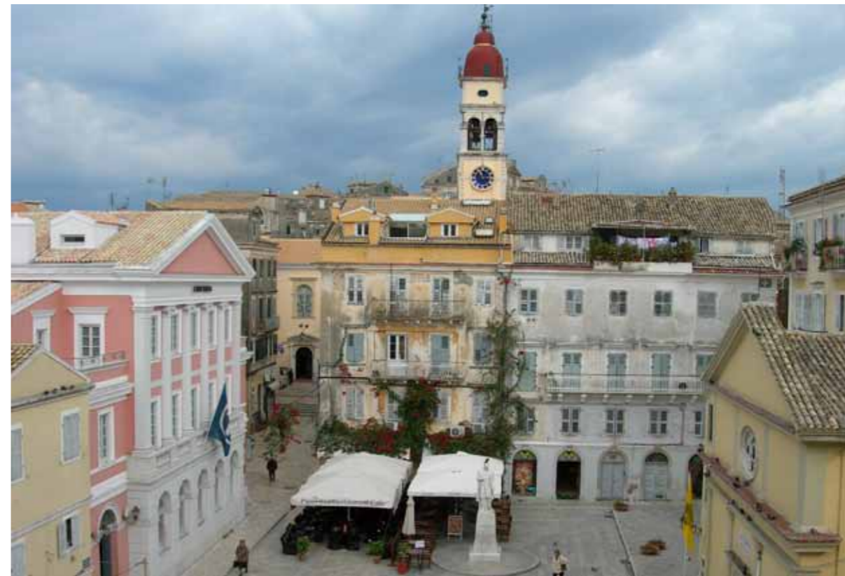
Corfu, forumi i heronjeve të luftës së Qipros

Teresija e fortifikatave dhe Qytetit të vjetër Krf ndodhet në një pozitive strategjike në hyrje të detit Adriatik. Renjet historike të qytetit vijojnë qysh prej shekullit 8. Para Krishtit