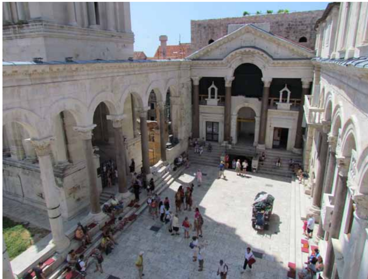
Split, Pallati Dioklecianit, Peristili