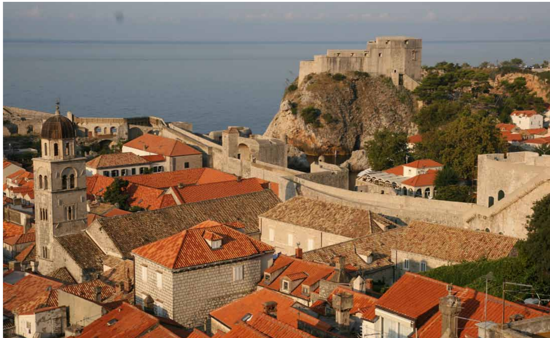
Dubrovnik, Fortesa e Lovrijencit

Gjat hulumtimeve arheologjike jane zbuluar muret qe e kane formuar bedemin e qytetit. Muret jane rezuar kur e kane humbur funksionin e mbrojtjes kurse toka eshte mbuluar me nje shtres sterile te dheut dhe eshte rafshuar per ndertimin e shkrijetores. Ka funksionuar me nderprerje prej shekullit 15. dhe matutje deri te Termeti i madh ne vitin 1667 pas te cilit kjo siperfaqe pjeserisht eshte mbuluar me mbeturina nga godinat e te renuara qe kane qene per reth dhe matutje jane shfrytezuat si depo i plehrave. Zona ku ka qene fura ka vazhduar te funksionoj edhe pak kohe kurse pjeset tjera jane shfrytezuat ne menyre sporadike dhe pa plan deri sa shkrijetorja definitivisht eshte mbuluar plotesisht. Metali i shkrirë eshte perdorur per shkrijenjen e kembenave, armeve artillerike dhe gjyle artillerike, dhe pajisje te tjera te arsenalit te Republikës. Nuk eshte prodhuar vetem per nevojat e vendit por edhe per eksport ne Spanj me te cilen Dubrovniku gjithemone ka kultivuar maredhenje te mira. Eshte eksportuar edhe ne Itali edhe ne Venedik ku kane qene mardhanjet e mira tregtare dhe i kane tejkaluar shume kundershtime te shumta kaluese qe kane rjedhur nga interesat dhe qellimet e tyre. Pjesa e drynave eshte mbuluar disa her qka ka krijuar nje rend stratigrafik. Gropimet ( hulumtimet) kane vertetuar supozimin per egzistimin e aktiviteve te koncentruara industrijale gjat kohes se shekullit te mesem dhe shekullit te vonshem ne kete pjese te qytetit.