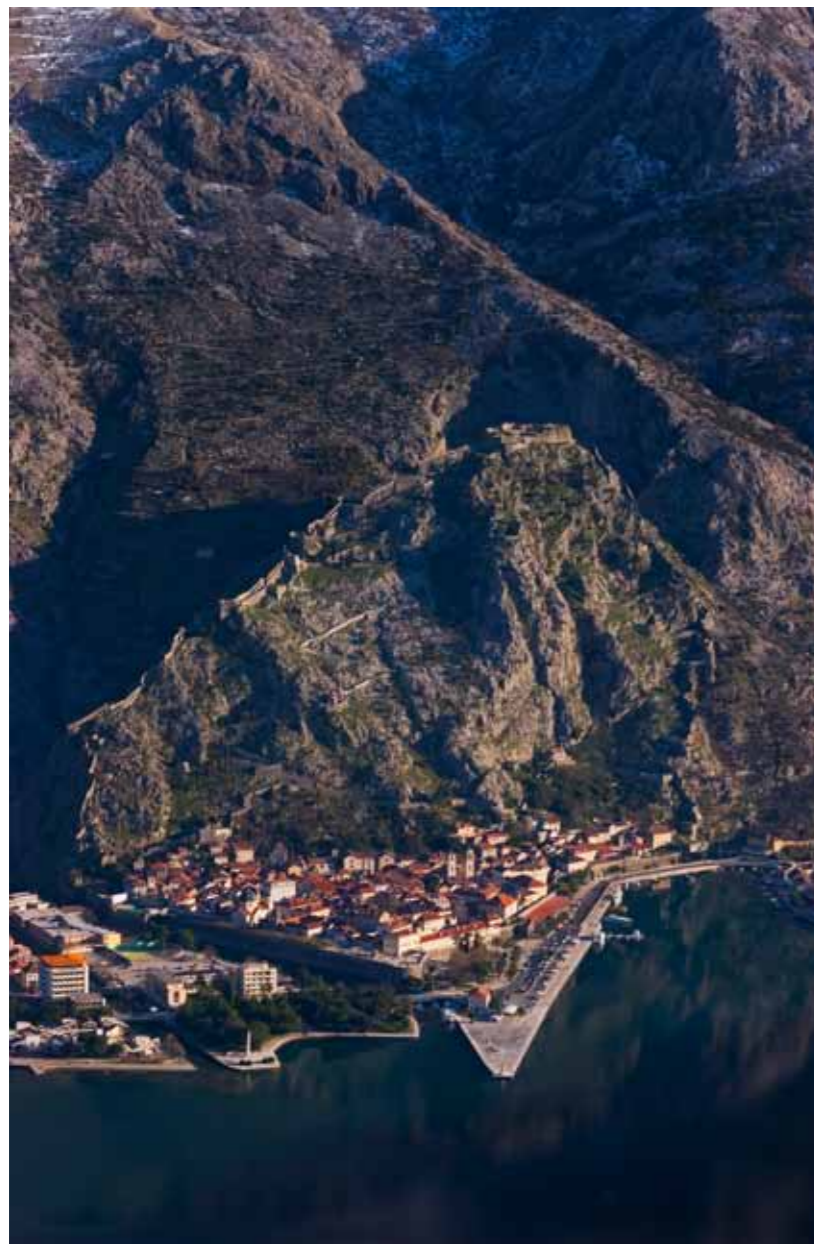
Qyteti i Kotorit me malin e Shen Ivanit