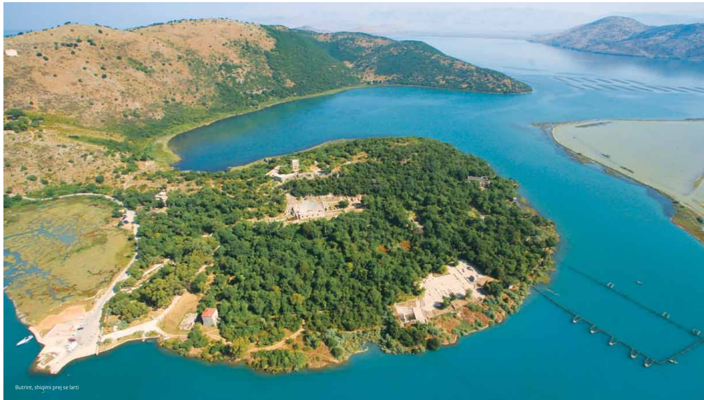
Butrint, shiqimi prej se larti

Q arku –zona reth qytetit antik Butrinti ne pjesen jugore te Shqiperise nuk eshte vetem nje stacion i shume llojeve te shkatëraura globalisht por eshte nje siperfaqe e pasur historike kulturore qka e ka merituar te regjistrohet ne regjistrin e trashegemise bote-rore te UNESCO-s. Parku nacional perfshine llojloj qeliza natyrore, gjysem natyrore dhe artistike, pershembul knetat me uj te ëmbel, dhe trunqje te hardhise se rrushit, male mesdhetare, shkoret ( gjethbajtes mesedhetar), pemishte dhe toke bujqesore si dhe ujera ngat bregut me lima dhe gurr dhe plazha me zall dhe pjese te hapura te halofitit dhe te tjera. Krejt keto qeliza i ruajn dhe i mbrojne shume lloj kafshve dhe bimeve duke perfshire edhe llojet te cilet globalisht dhe regionalisht jane ne ramje mu per kete shkak edhe kjo pjese( krahine) – zone e Butrintit eshte nje prej zonave dhe llojlljshmërise biologjike ne Shqiperi.