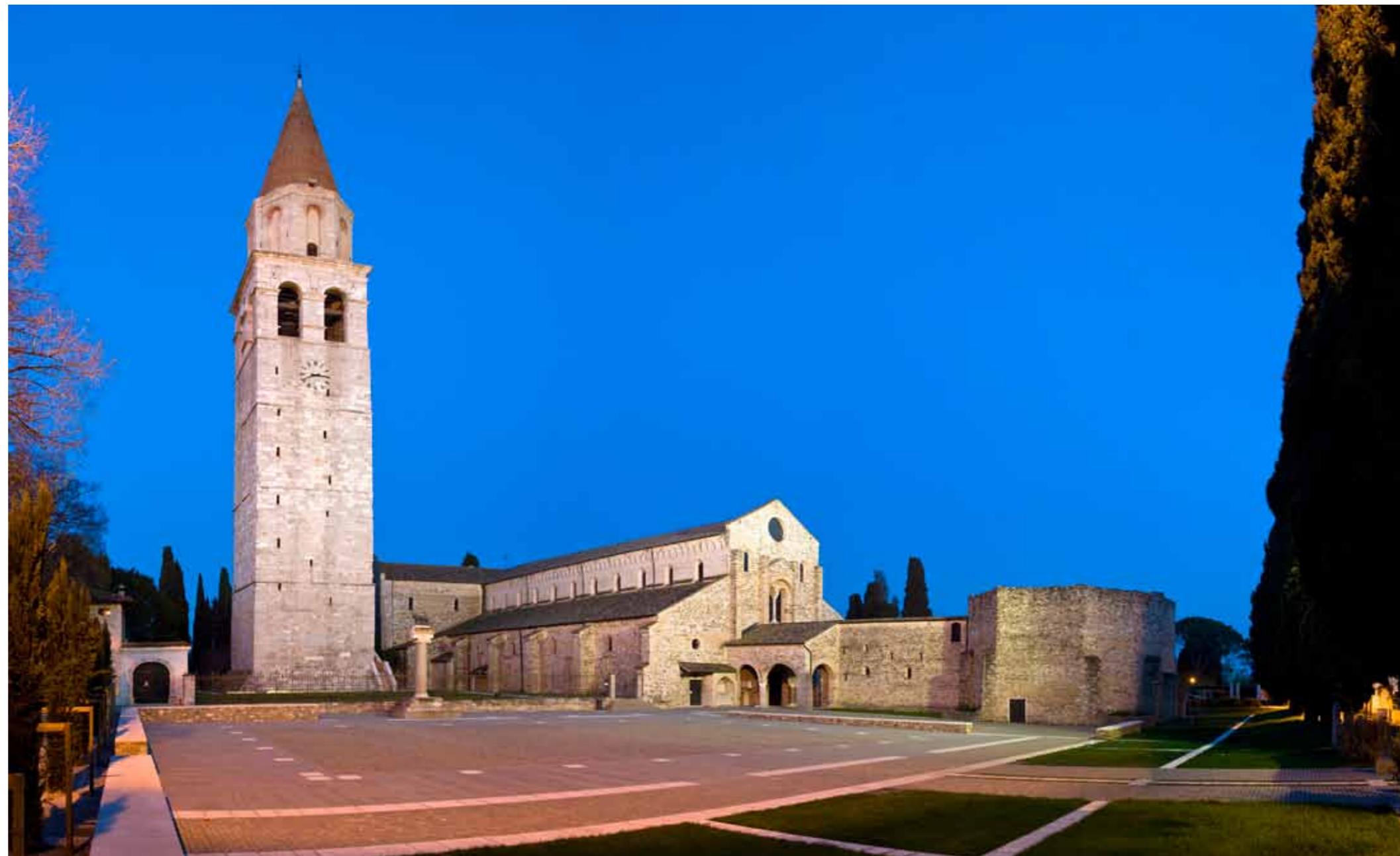
Aquileia, Bazilika dhe sheshi Capitol