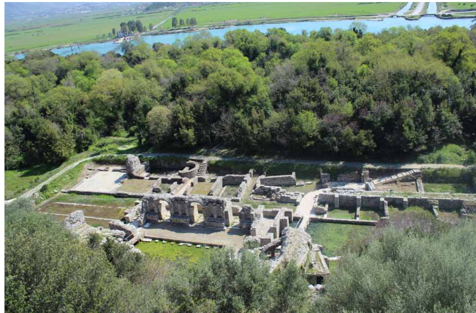
Butrint, gropat arkeologjike

Butrinti është një mikrokosmos i historisë së Mesdheut dëshmitar i ngritjes dhe ramjes së perandorive të mëdha të cilat kanë sunduar në këtë zonë ( krahinë). Sot është kjo një komplet i përmendoreve që janë krijuar gjatë kohës 2000 vjeçare prej kohës së Helenëve nga shekulli 4 para Krishtit deri të kështjallat Otomane të ndërtuara gjatë fillimit të shekullit 19.