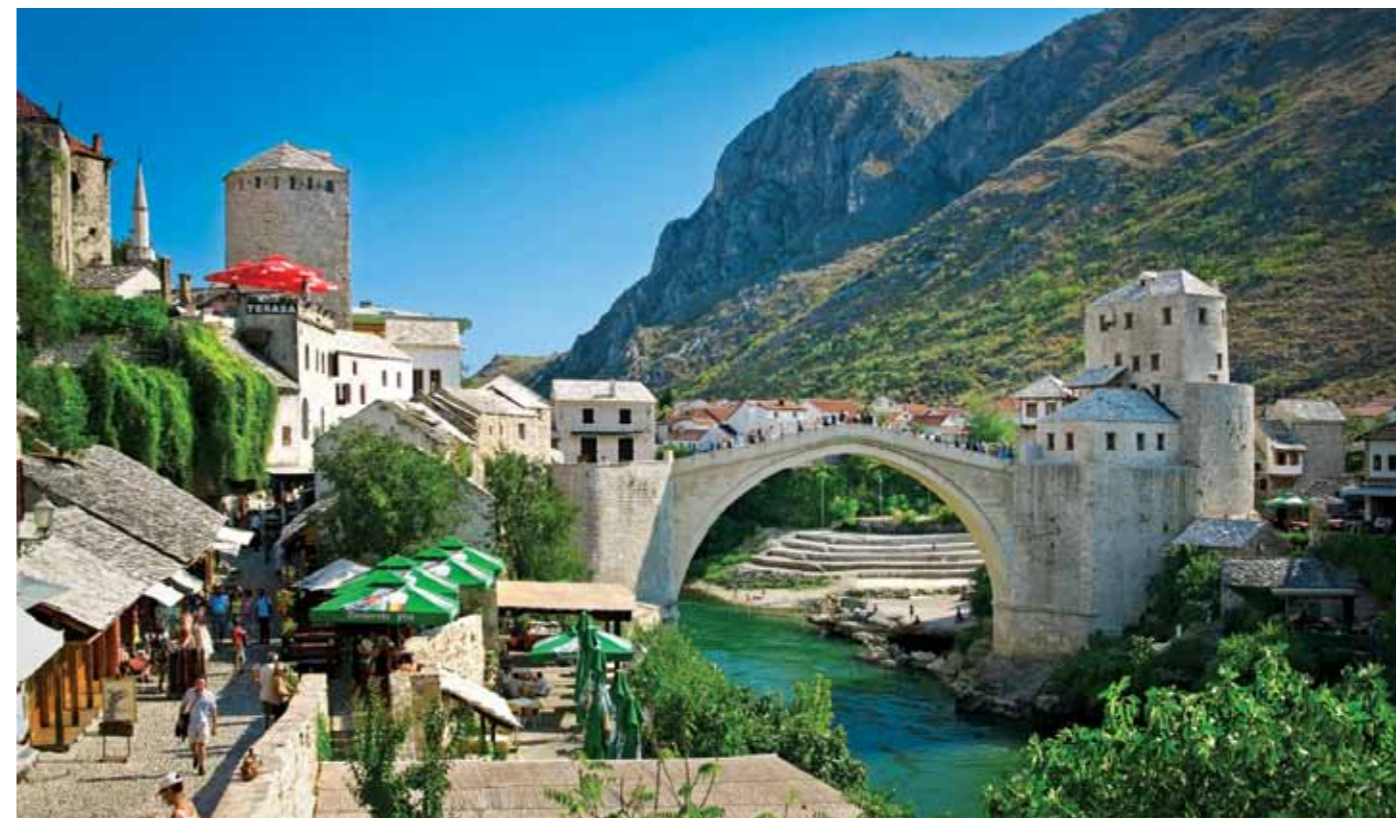
Mostar, urra e vjeter

Me „Renesansen“ e Ures se Vjeter dhe rethines se tij jane renovuar dhe jane forcuar forcat simbolike dhe rendesija e qytetit te Mostarit, si nje simbol i jashtzakonshem dhe univezral i bashkjeteses se bashkesive te kulturave te ndryshme, me prejardhje etnike dhe fetare, duke i potencuar qellimet e pandërprera te solidaritetit njerzor per arrijten e paqes dhe bashkpunimit te forte para katastrofave te mëdha.