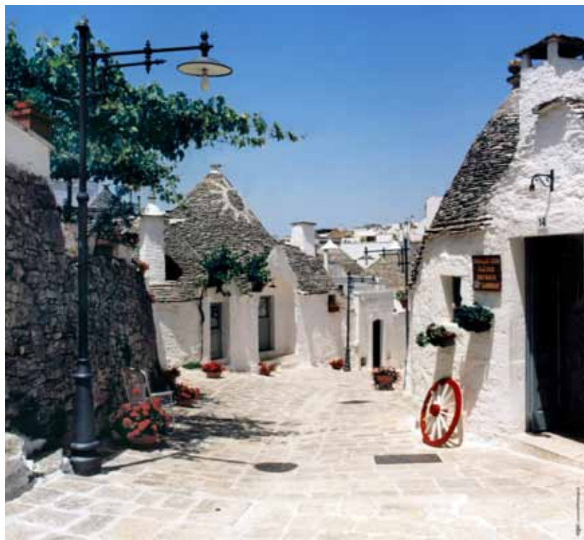
Alberobello, Trulli rruga

trullave formon „truallia“ gjegjesisht nje grupe i ndertesave, me obore te vogla dhe sheshe te vogla me nje strumbullar ne mese. Ku ndodhen edhe strofulat e kafshve, bashqeve te vogla te rethura te cilat jane afer shtepive. Trulli me i vogel ne te cilin me se shpeshti ndodhen separet ( pjesa e ndar e kuzhines) per shtrate dhe vatra, jane te lidhura me trullin kryesor dhe me harqet te ulta. Trullet e fshatrave jane prezent ne krejt zonen Itria. Mirpo i vetmi vendbanim i qytetit me te vertet eshte nje teresi e pandar e shenuar me keto ndertesat tipike eshte Alberobello me dy kvarte te tij, Monti dhe Aia Piccola. Kvarti Monti eshte ndertuar ne nje teren te pjeret, dhe shtrihet ne nje siperfaqe prej 15 hektarve dhe perfshine