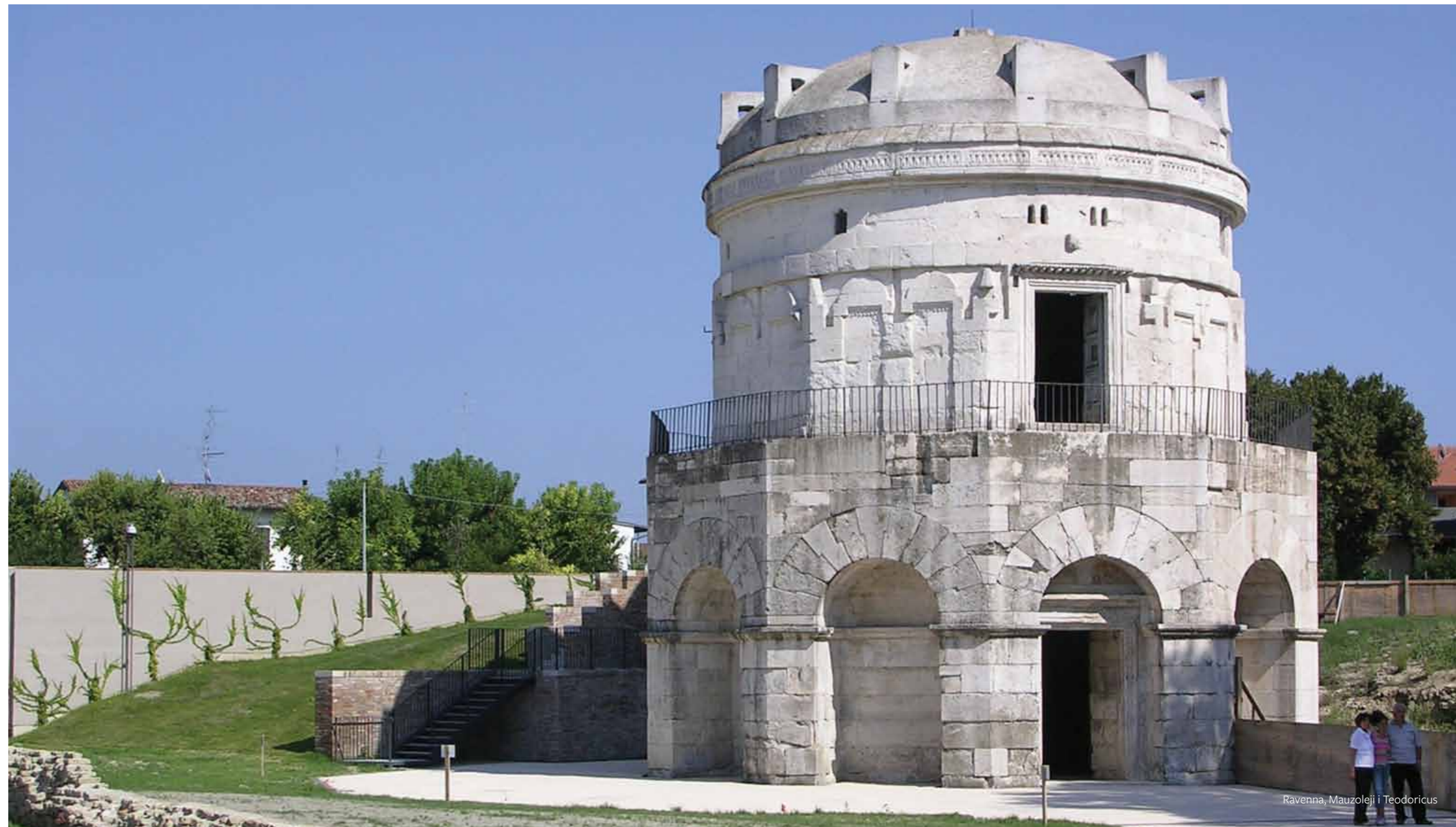
Ravenna, Mauzoleji i Teodoricus

Ravenna është shpallur nga UNESCO si lokalitet i trashëgimise boterore kur ne vitin 1996 tet permendore nga shekulli 5 dhe 6 jane shtuar ne regjistrin e UNESCO-s si trashëgimi boterore( World Heritage List). Permendoret e kristijanizmit te hershem te Ravennes konsiderohen si pasuri boterore nga aresyet e shenuara me posht: „Lokalitetet kane nje vlere jashtzakonisht univerzale per shkak te shkathetise kulmore te artit mozaik ne keto permendore si dhe nga deshmija per artin dhe lidhjet fetare dhe kontaktet ne kohen shume te rendesishme te historise kulturore Europijane“.