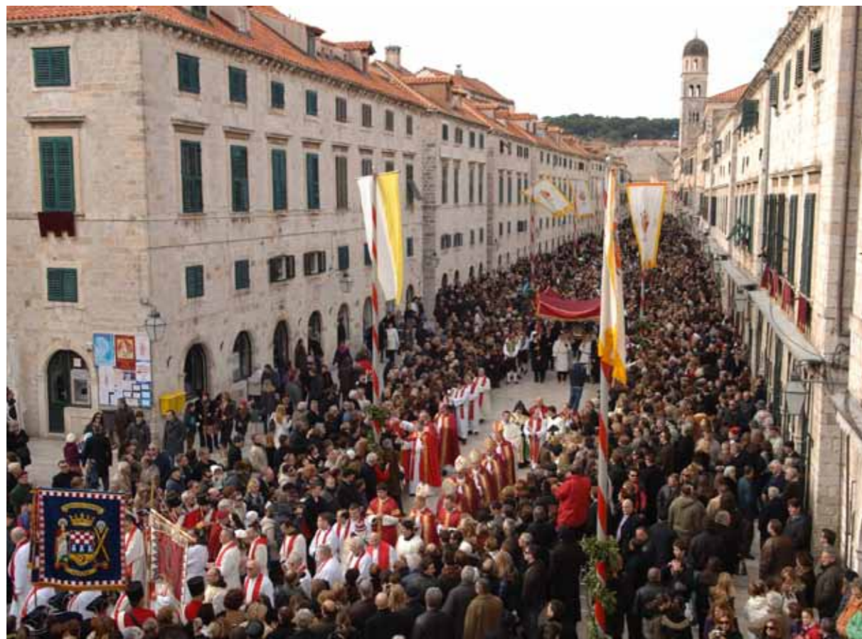
6Dubrovnik, Rituali ne ditën e Shen Blasiusit

siprancës se anijes. Pozit e cila kundrejt detit ka qene e kufizuar me shkembim te lart deri ne 35 metra , kurse nga pjesa verijore edhe mjaft e repishme pjesa malore ka formu një siguri relative të vendbanimit keshtu qe armiqtet , okupatorët dhe banditet e asaj kohe te cilet jane afruar nga pjesa e tokes ose e detit kane mujt te shifen dhe zbulohen me kohe. Kjo ka qene nje pozite strategjike ku ka pasur mundesi te jash-tzakonshme te mbikqyrjes se anijeve te cilat kane udhetuar ( lundruar) kah drejtimi lindor i Adriatikut te njohur qysh ne kohën antike. Gjiri i mbrojtur me nje qender te mire dhe sujedheses se pjert me burime te ujt te pijshem kane mundesuar zhvillimin e jetes dhe kultivimin e banimit. Sipas legjendes ky vendbanim eshte formuar ne pjesen e kthyer kah pjesa tokesore me se pari me gardh i rethuar me vone me murin e that.