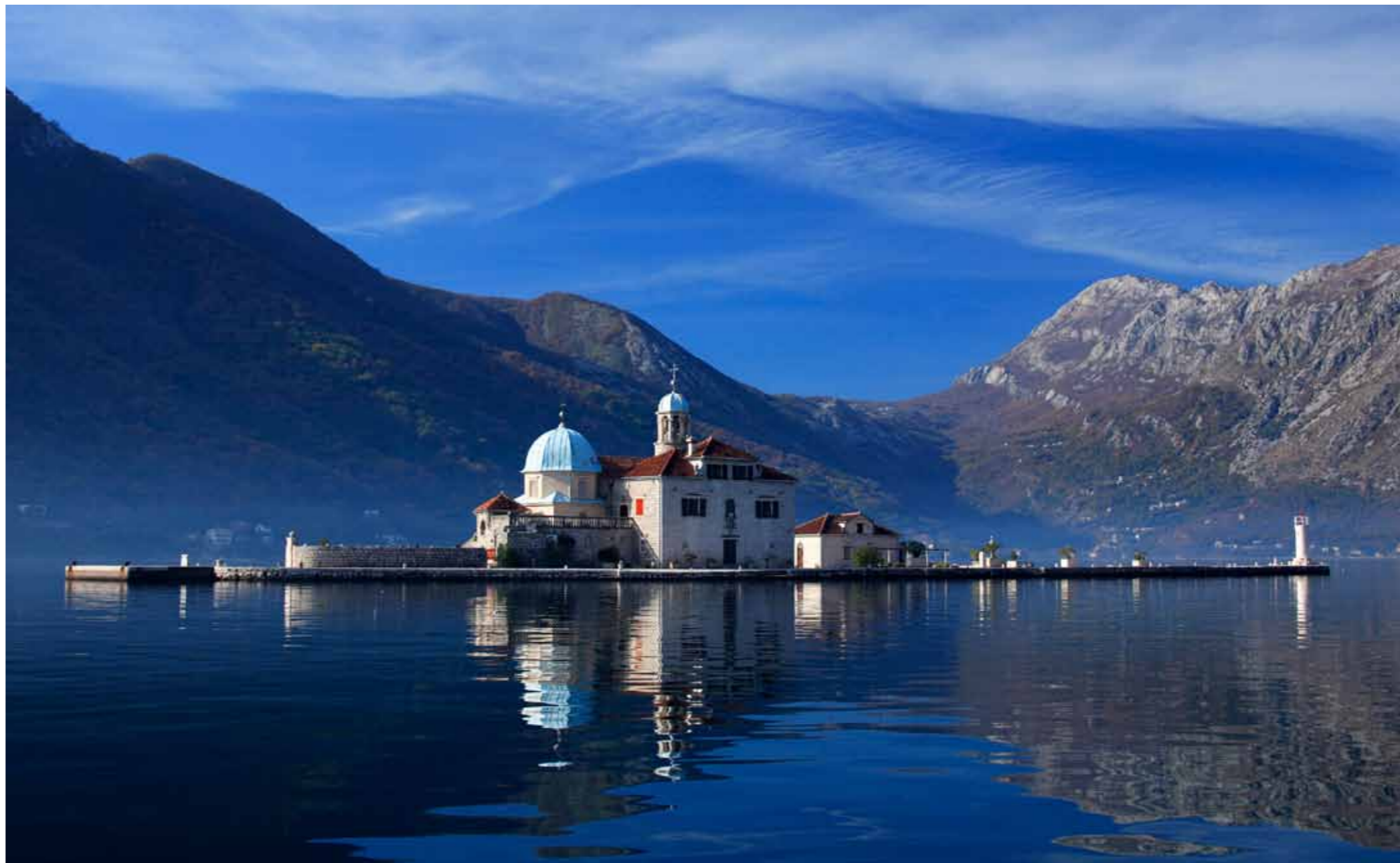
Ishulli i Zonjes se jone te shkembive

Qyteti e ka pasur Statutin e vet prej v. 1301 i shtypur ne Venedik ne v.1616. Dikur shume ne ze qender e zanateve mesjetare Kotori sot mbured edhe me shume piktura qe jane neper shitore dhe me vitrina karakteristike „ne gjuj“. Posaqem ne kohen e shekullit te mesem kane lulëzuar dhe shume zanate dhe pune artistike ne shume punëtori. Jane themeluar shume kuvende (confraternities) kurse lenda e pare organike sidomos nga metali per ( artar dhe farkatar) , likur dhe dru kane ardhur nga prapashpina. Keto kuvende ( vellazerore) kane funksionuar njehkosisht edhe si