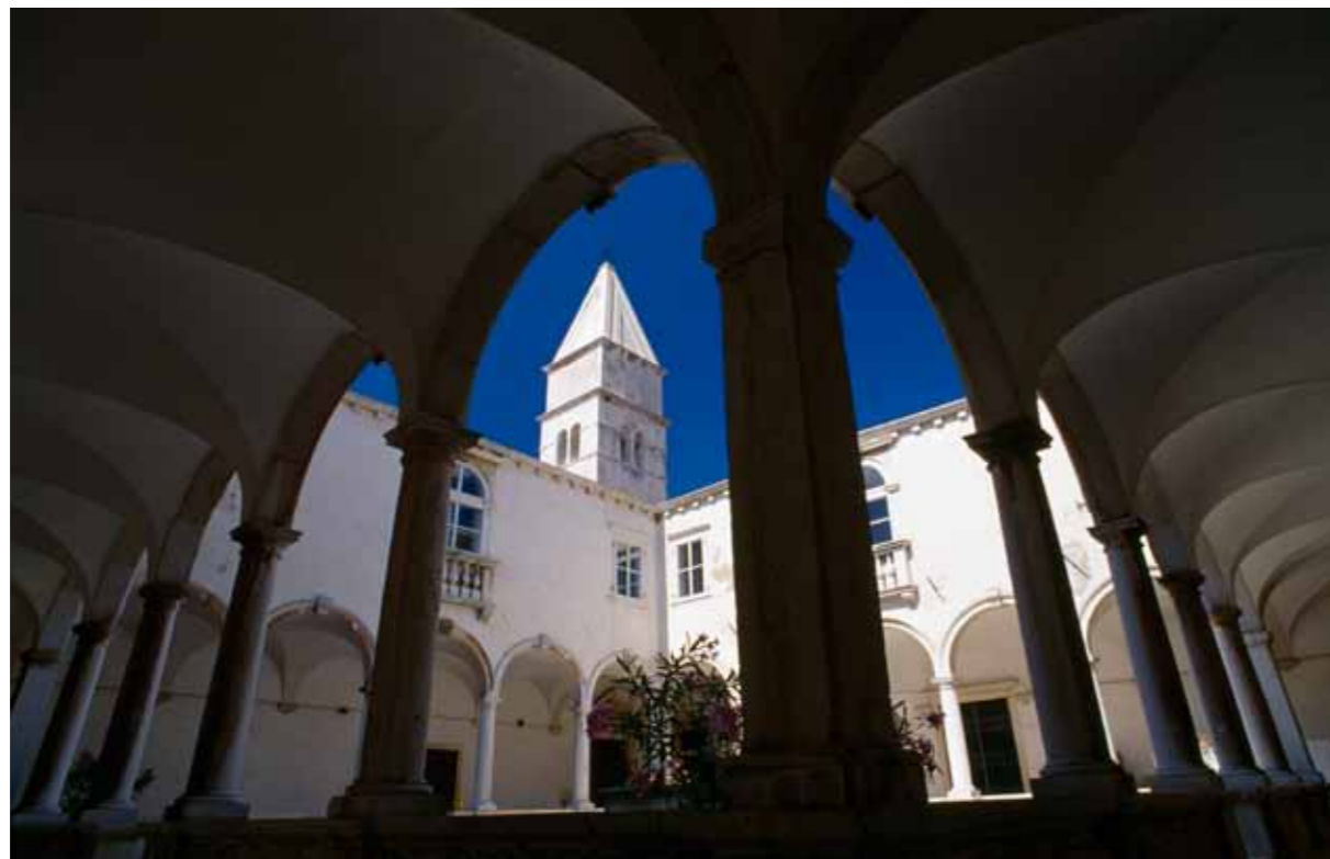
Piran, vendi manastirit Minorite

Banoret e vjeter Romak jane mbajtur mbrenda ne qytet te forcuar edhe pse ardhacakat Slav kane qene ne mbrapashpine keshtu ngjajshem edhe me qytetet tjera te Istres perendimore me shekuj kane jetuar sipas dokeve dhe zakoneve te Venedikut dhe kane folur me dijalektin Venedikas. Qyteti gjithashtu nuk eshte ndryshuar shume : latinisht Pyrrhanum , ndermjet vitit 670 dhe 1282 paraqitet si Piranum , Piranon , Pyranum , me vone Pirano , lokalisht quhet Piramin , kurse ne gjuhen Slovene Piran. Shpjegimi nga rjedh kjo fjale Piranom është me i besueshem se vjen nga fjala greke pyr ( zjari ose fener deti) duket me i besueshem .