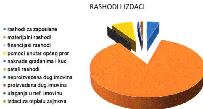
Grafikon 2: Struktura rashoda i izdataka Prvih izmjena i dopuna Financijskog plana za 2024. godinu prema ekonomskoj klasifikaciji