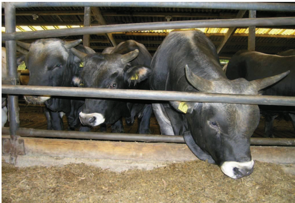
Slika 3. Tov junadi istarskog goveda Motovun