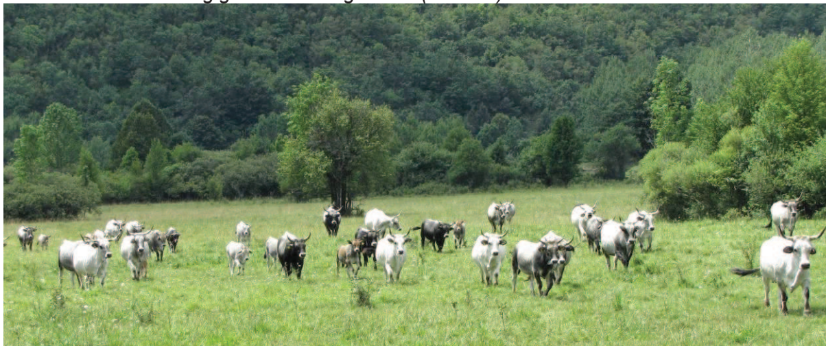
Slika 2. Stado istarskog goveda u Podgaćama (Lanišće)

Kod dosadašnjih šest uzgajivača koji su s AZRRI-em organizirali kooperantske odnose, te kod novih uzgajivača planira se tijekom 2013. godine povećati stada s 20-30 rasplodnih grla u vlasništvu AZRRI-a. Osim navedenog planira se povrat 10-tak gravidnih junica koji se vraćaju u sustav poticanja sukladno potpisanim ugovorima o uzgoju istarskog goveda s uzgajivačima.