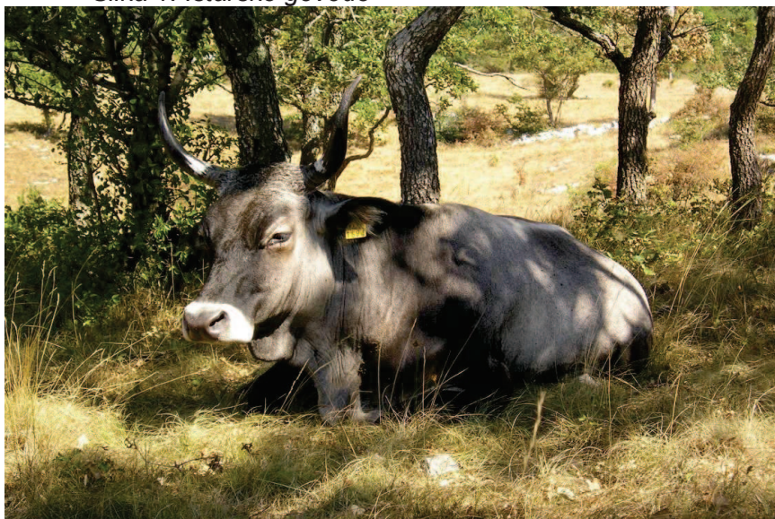
Slika 1. Istarsko govedo