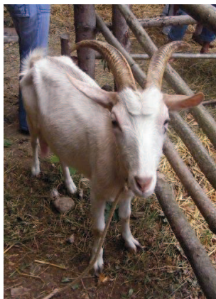
Slika 4. Jarac pasmine istarska koza

Pretpostavlja se da je uzgojno područje istarske koze rasprostranjeno na više država (Slovenija, Italija) istarsku kozu možemo smatrati prekograničnom pasminom ( engl. transboundary breed ), te u suradnji s odgovarajućim partnerima iz predmetnih država zatražiti potpore u održanju ove za nas značajne pasmine.