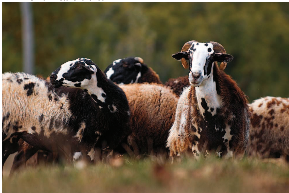
Slika – Istarska ovca

U svrhu potpore održivosti uzgoja i proizvodnje istarske ovce u laboratoriju za razvoj mesnih proizvoda od mesa izvornih pasmina i divljači iz Istre razvit će se tijekom 2013. i standardizirati dva mesna proizvoda od mesa ovčetine u obliku sušenog komada mesa i jednog steriliziranog mesnog proizvoda od mesa istarske ovce.