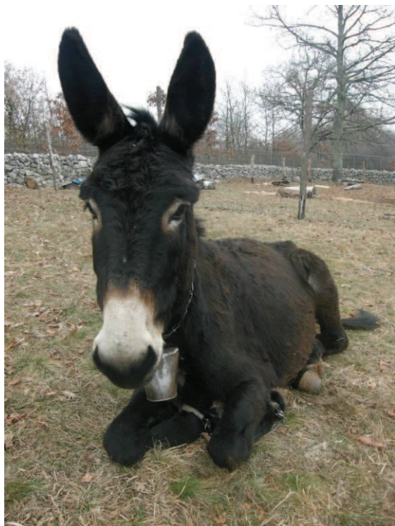
Slika. Istarski magarac