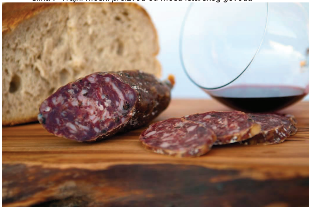
Slika .- Trajni mesni proizvod od mesa istarskog goveda

U ovoj se godini planira razviti veći broj mesnih proizvoda, razrađeno s obzirom na program trajne zaštite pojedinih izvornih pasmina, odnosno vrste divljači.