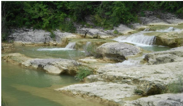
Slika 3. Pazinčica ( www.istrapedia.hr )

Pazinčica je najduža ponornica u Istri, izvire u zaleđu Boruta i ima pet stalnih bočnih pritoka (Slika 3). Glavni tok Pazinčice dugačak je 18 km, a obilježava ju izrazita bujičnost i pojave velikih voda. Sliv Pazinčice izdužen je u pravcu sjeverozapad-jugoistok, s strmim bočnim pritocima koji se gotovo okomito spuštaju.