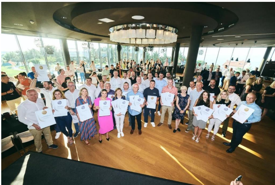
Slika 8. Nagrađeni istarski vinari na natjecanju Decanter 2024 ( www.vinistra.hr )

Istra je vodeća hrvatska vinarska županija. Istarska vina, posebice Malvazija istarska postiže vrhunsku kakvoću i premijske cijene na domaćem i vanjskim tržištima. Tome svjedoče i brojne nagrade poput onih dobivenih zadnjih nekoliko godina na međunarodnim natjecanjima poput Decantera.