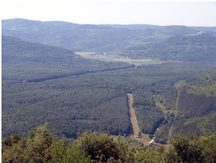
Slika 7. Motovunska šuma

Na obroncima Ćićarije i Učke smještena je eurosibirska zona, gdje su bukove šume dominantne. Ovdje se uglavnom nalaze šume sjemenjače, s područjima pod crnim borom. Ove šume imaju gospodarski značaj zbog proizvodnje kvalitetne drvne mase.