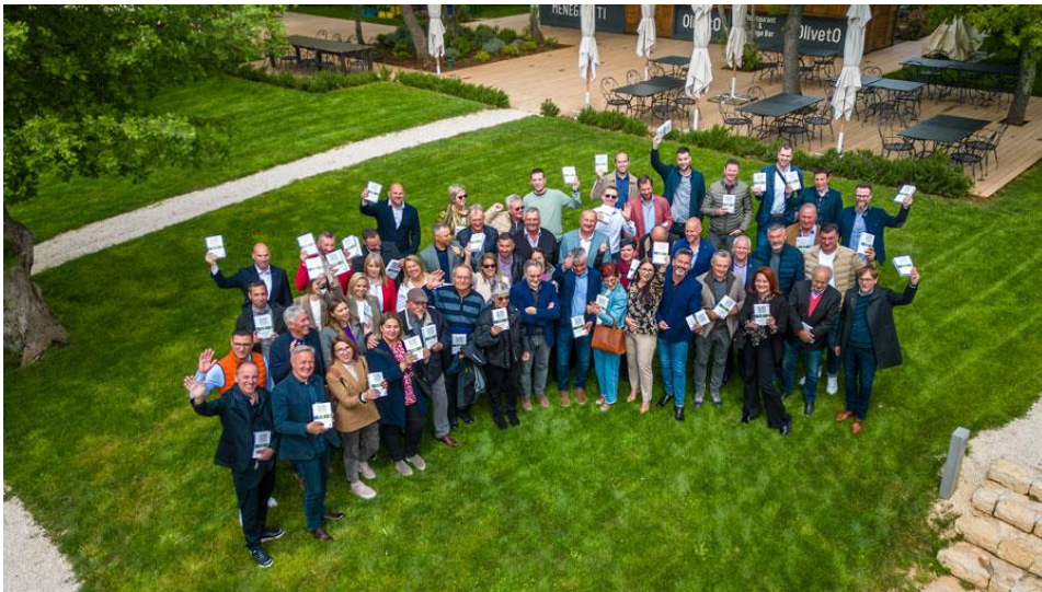
Slika 9. Nagrađeni istarski maslinari na natjecanju Flos Olei 2024 ( www.istra-istria.hr )

Proizvodnja maslina 2023., uz prosječni prinos od 3 t/ha može se procijeniti na 11,7 tisuća tona, a proizvodnja maslinovog ulja, uz randman od 15% na 1,77 milijuna litara. Za istarsko maslinarstvo još važnije od količine proizvedenog maslinovog ulja je njegova kakvoća. Istarska maslinova ulja redovito postižu vrhunsku kakvoću, što dokazuje visoki broj odličja na prestižnim svjetskim ocjenjivanjima poput Flos Olei-a, na kojemu je Istra zadnjih nekoliko godina najnagrađivanija svjetska regija, ali i premijske cijene koja takva ulja postižu na domaćem i vanjskim tržištima.