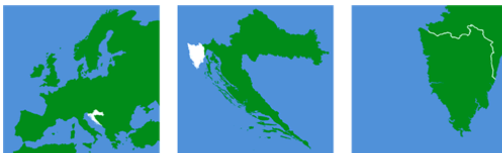
Slika 1. Položaj Istarske županije

Istarski poluotok je geografski podijeljen između tri države: Republike Hrvatske, Republike Slovenije i Republike Italije (Slika 1). Manji dio sjeverne strane Miljskog poluotoka, površine manje od 40 m 2 , pripada Republici Italiji, Koparski zaljev i dio Piranskog zaljeva, ukupne površine 386 km 2 pripadaju Sloveniji. Glavnina poluotoka, koja obuhvaća površinu od 3.130 km 2 , nalazi se u sastavu Republike Hrvatske. Istarska županija proteže se većim dijelom Istarskog poluotoka. Ukupna površina Istarske županije iznosi 2.812,97 km 2 , a nalazi se na krajnjem sjeverozapadu Republike Hrvatske. Županija graniči s Primorsko-goranskom županijom na istoku i jugu, sa Slovenijom na sjeveru te s Italijom na zapadu duž morske obale koja se proteže 578 kilometara. Na području Istarske županije nalazi se 46 otoka i otočića te 42 manje nadmorske tvorbe (hridi). Zahvaljujući svojoj izuzetnoj lokaciji u sjeveroistočnom dijelu Jadranskog mora i blizini razvijenih europskih regija, geoprometni položaj Istarske županije je vrlo povoljan. Na primjer, administrativno središte Županije, Pazin, udaljeno je 539,95 km od Beča, 555,82 km od Budimpešte, 777,91 km od Rima i 946,00 km od Bruxellesa, dok je udaljenost do Beograda 606,78 km. Stoga je Županija oduvijek igrala važnu ulogu kao most koji povezuje srednjoeuropski kontinentalni prostor s mediteranskim područjem.