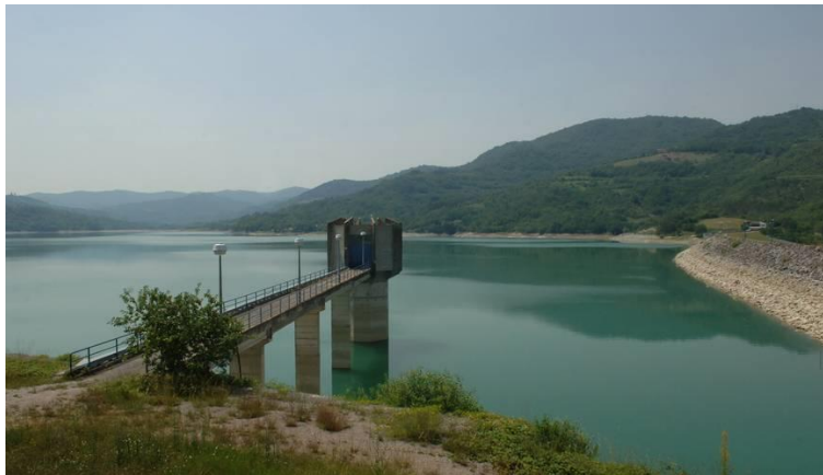
Slika 4. Akumulacija Butoniga

Akumulacija Butoniga se nalazi nizvodno od mjesta gdje se susreću tri glavna bujična ogranka – Butoniga, Dragučki i Račićki potok (Slika 4). Sliv akumulacije nalazi se unutar fliškog bazena središnjeg dijela poluotoka. Površina sliva iznosi 73 km 2 , a maksimalna dubina vode u akumulaciji doseže oko 16 metara. Volumen akumulacije iznosi 19,7 milijuna m 3 , pri čemu se na korisni volumen odnosi 17,5 milijuna m 3 . Iz akumulacije se vrši cjelogodišnje crpljenje za vodoopskrbu, s intenzitetima koji ne padaju ispod 200 litara u sekundi kako bi se osigurao kontinuitet rada uređaja za kondicioniranje i minimalne brzine tečenja u magistralnim cjevovodima sustava Butoniga. Akumulacija Butoniga ima ključnu ulogu u vodoopskrbi južne Istre, posebice tijekom ljetnih razdoblja s visokom potrošnjom. Tijekom ljetnih 90-ak dana, intenziteti crpljenja se povećavaju na vrijednosti do maksimalno 500 – 600 litara u sekundi.