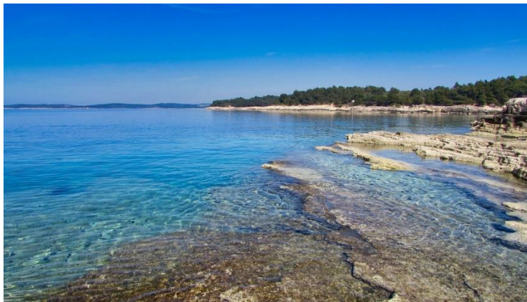
Slika 5. Zapadna obala Istre

Istarski poluotok, okružen Jadranskim morem sa tri strane, ima izuzetnu stratešku važnost mora kao prirodnog i ekonomskog resursa. Sjeverni Jadran je morfološka cjelina koja doseže dubine do 100 metara, s prosječnom dubinom od 35 metara. Ovo more ima visoku salinitetnu koncentraciju od 38,30‰, pri čemu područje Sjevernog Jadrana karakterizira nešto niža razina saliniteta zbog priliva voda iz velikih talijanskih rijeka. Jadran je umjereno toplo more, s površinskim temperaturama koje ljeti dosežu iznad 25°C, dok su najniže temperature zabilježene u veljači, oko 7°C.