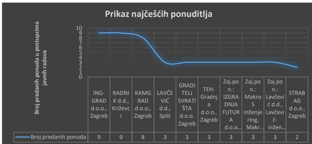
Grafikon 3: Prikaz 10 najčešćih ponuditelja u postupcima javnih radova u razdoblju od 2015. – 2020.