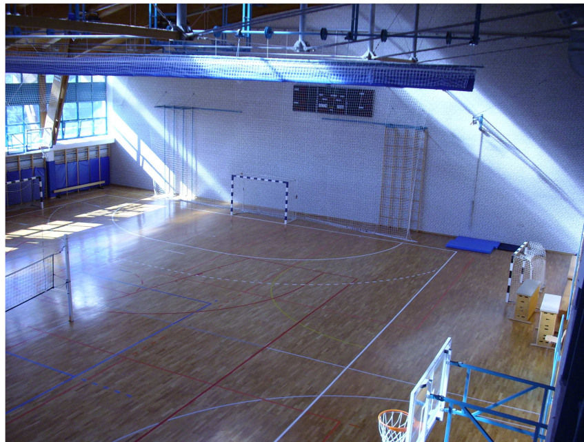
Osnovna škola Mate Balote Buje

Na temelju prikupljenih podataka, a sukladno iskazanim potrebama škola predlaže se izgradnja školskih sportskih dvorana s procijenjenim vrijednostima investicije kako je dano u tablici 6, uz slijedeće napomene: