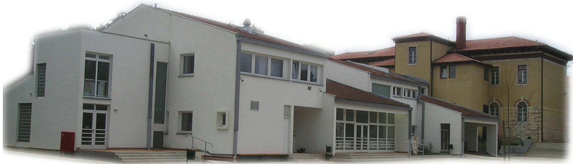
Osnovna škola Mate Demarin Medulin