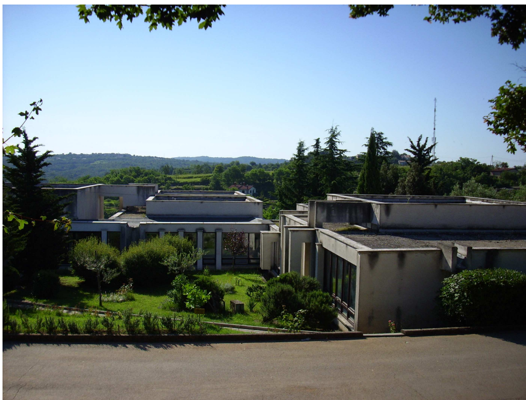
Osnovna škola Mate Balote Buje

Na temelju prikupljenih podataka, a sukladno iskazanim potrebama škola i namjerama gradova koji su osnivači škola, predlaže se izvršiti rekonstrukciju i dogradnju škola odnosno izgradnju novih školskih objekata sa školskim sportskim dvorana s procijenjenim vrijednostima investicije po osnivačima kako je dano u tablici 2, uz napomenu da Grad Rovinj i Grad Umag nemaju potrebe za kapitalnim ulaganjem u škole.