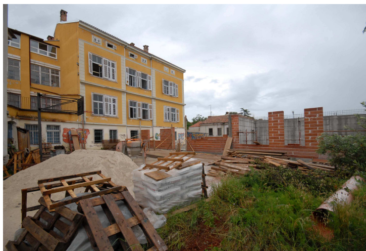
Tehnička škola Pula